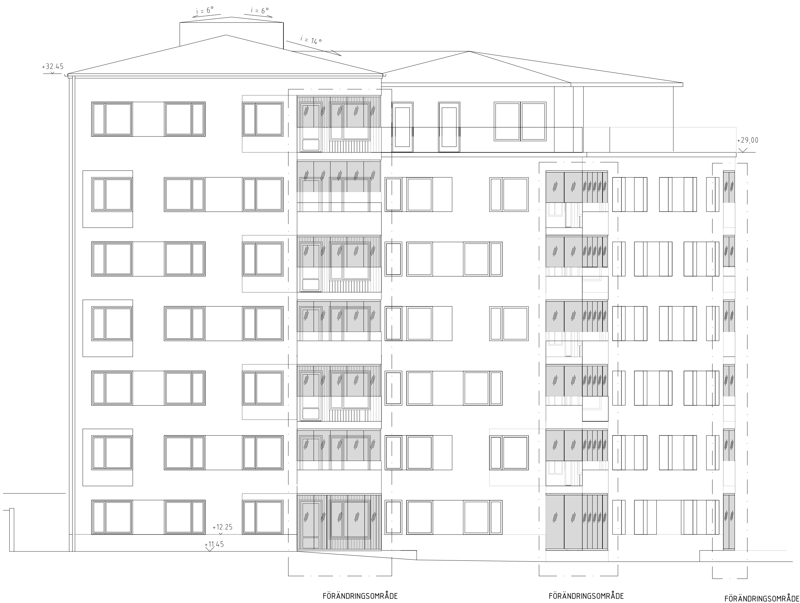
FASAD MOT NORDVÄST 2 nvA