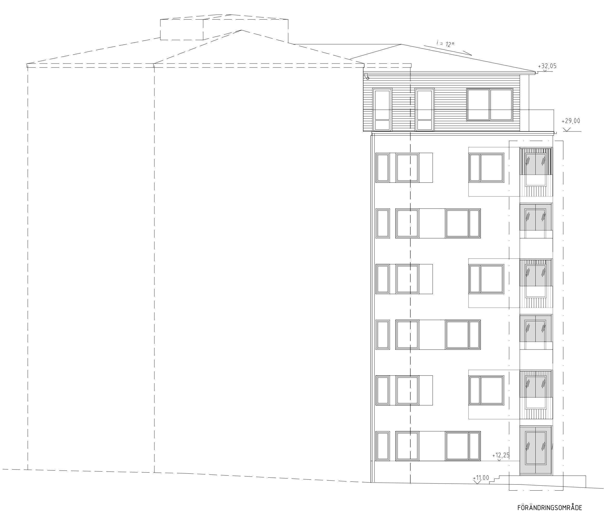
FASAD MOT NORDVÄST 2 nvB