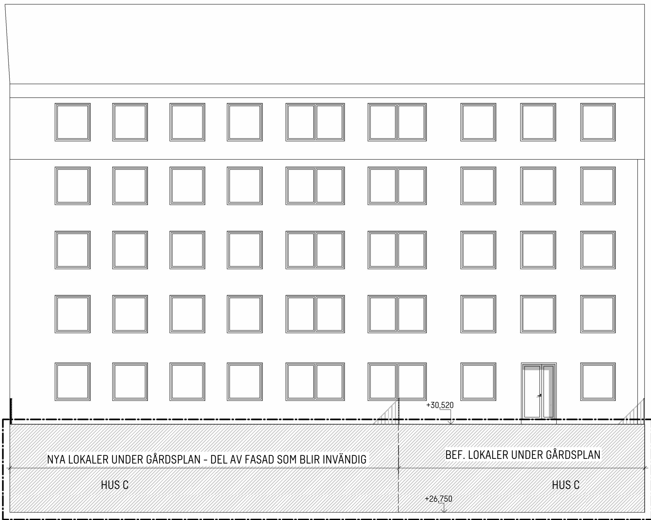
GÅRDSFASAD - HUS B

PLANER SE A-40-1-07 TILL 13 TAKPLAN SE A-41-1-19 SEKTIONER SE A-40-2-01 OCH A-40-2-02 UTVÄNDIG MATERIAL- OCH KULÖR BESKRIVNING SE A1