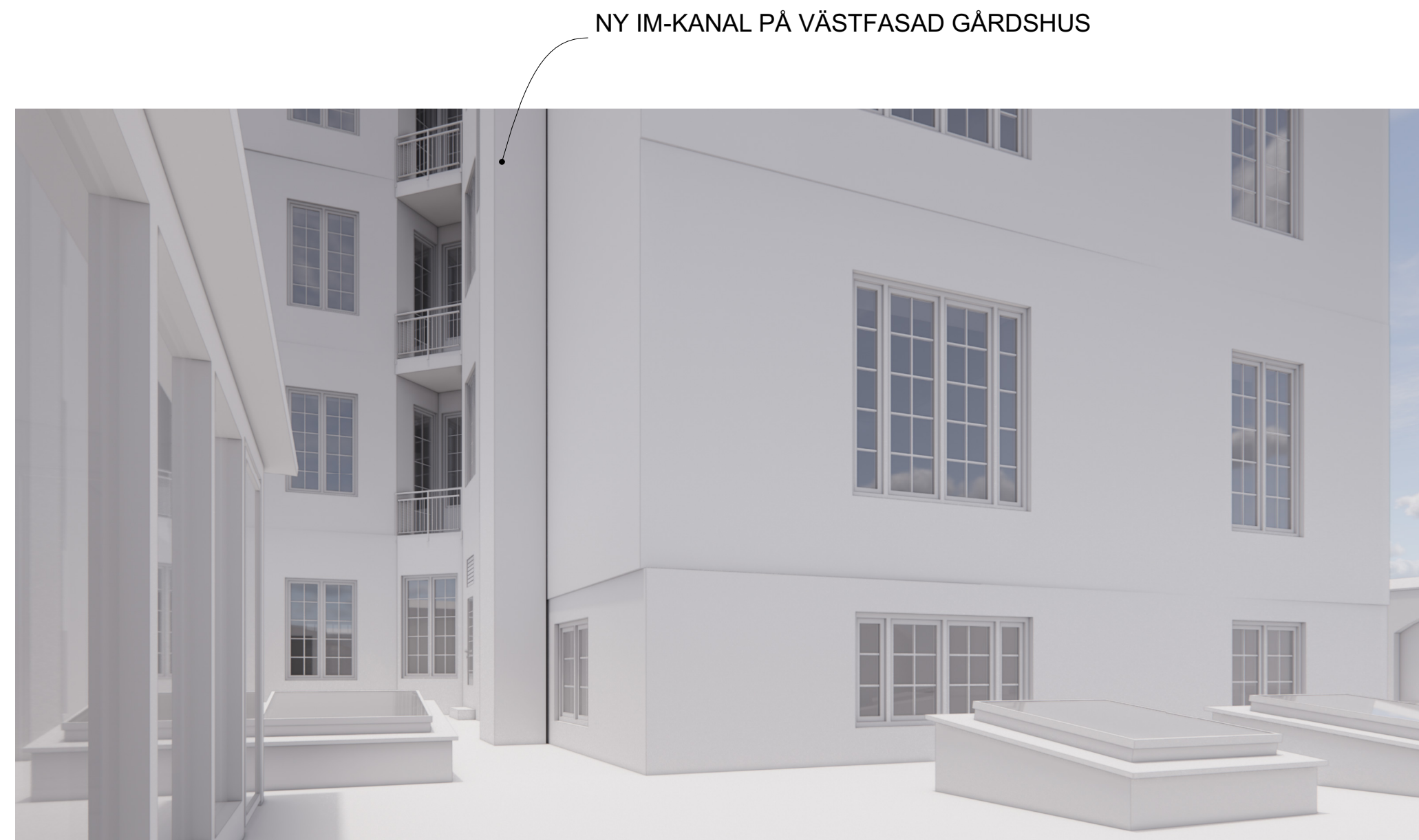
Vy IM-kanal inplacerad på fasad sedd från gården