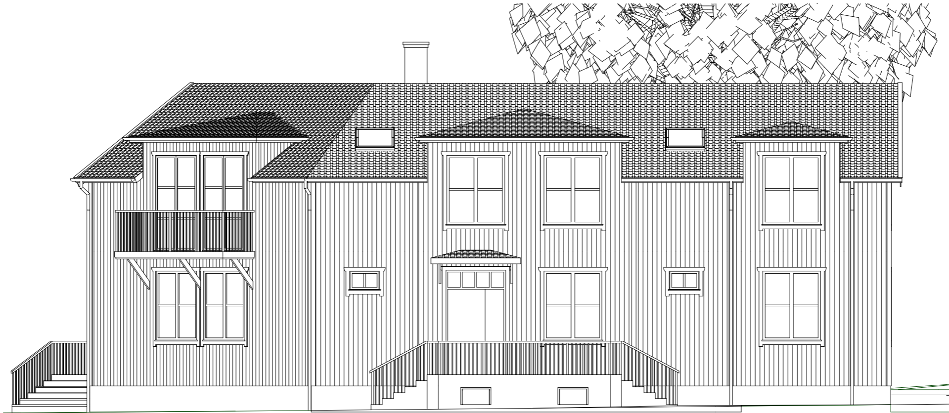
FASAD MOT NORDOST

Inkom till Stockholms stadsbyggnadskontor - 2023-11-06, Dnr 2023-14177 Tillhör Stockholms stadsbyggnadsnämnds beslut, Lovbeslut - Avslag - 2024-05-23, Handl. Robin Julin