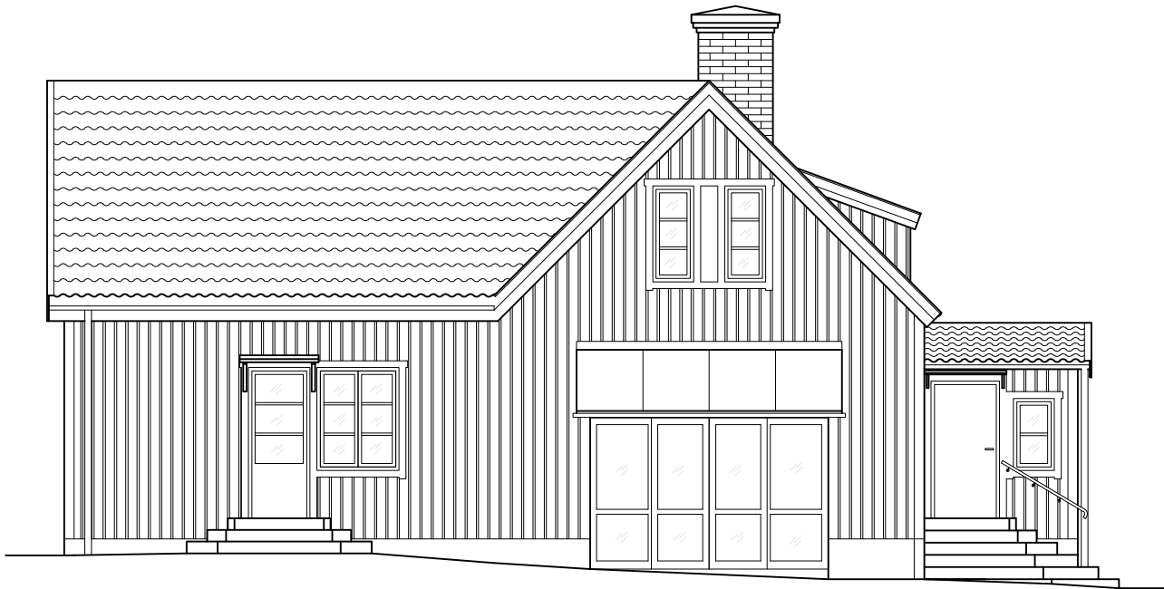
BEF FASAD SV

PLAN BV & ÖV RIVES. KÄLLARE/GRUND SPARAS.