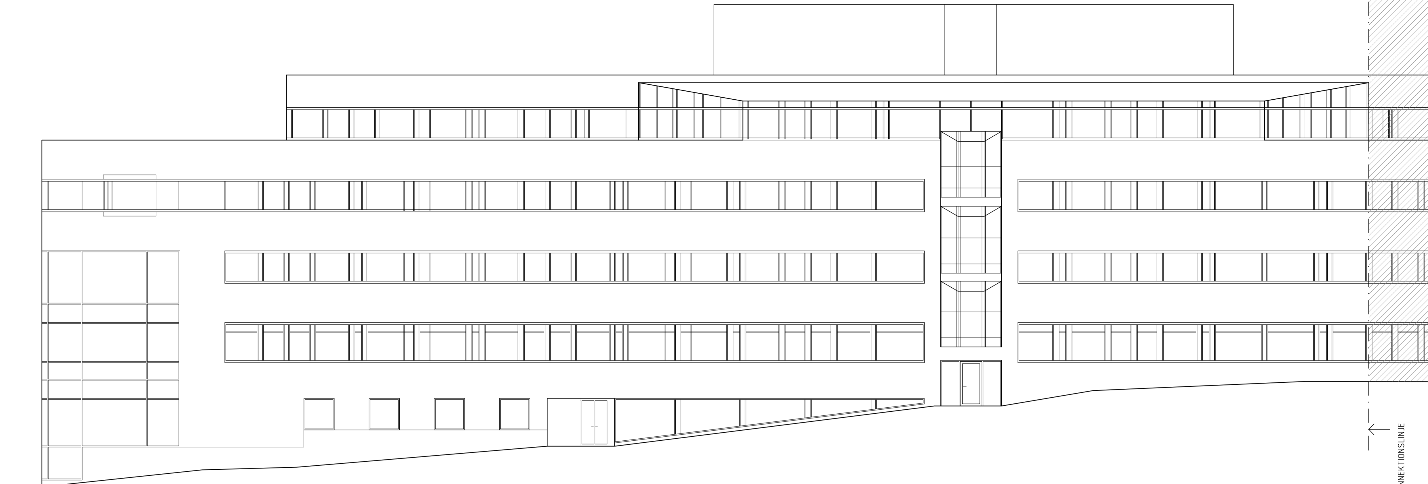
FASAD ÖST, DEL 01 SKALA 1:200 (A3)