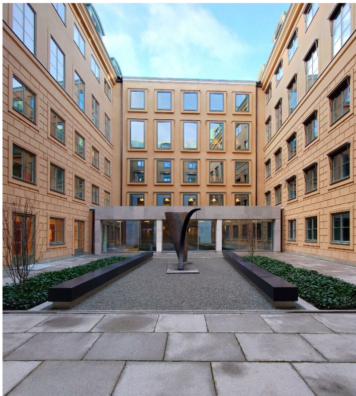
Västra gården efter ombyggnation.