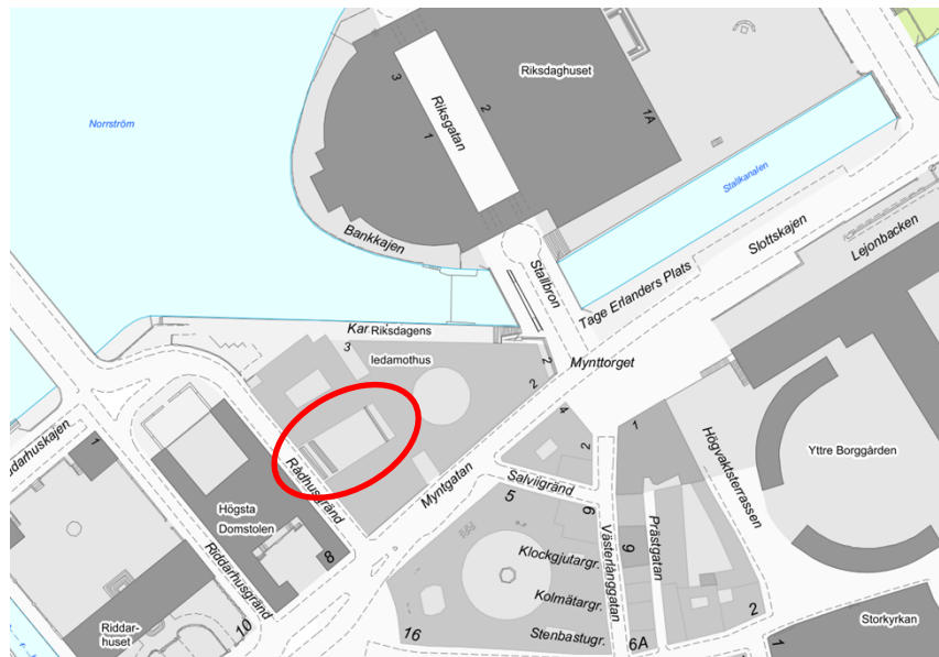
Lokalisering av aktuellt planområde inringad med röd ring.

Det aktuella planområdet omfattar cirka 500 kvadratmeter och utgör en liten del av gällande detaljplan.