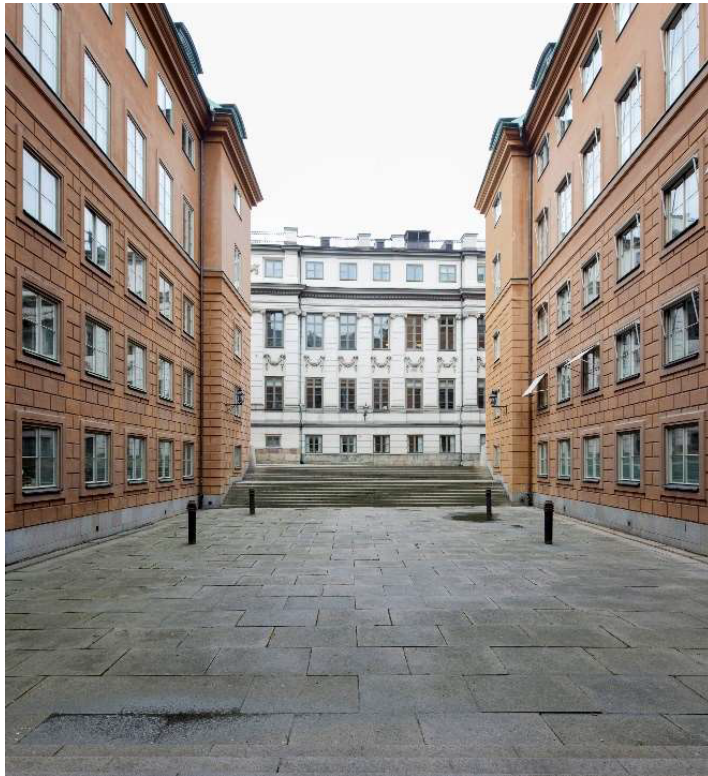
Västra gården före ombyggnation. Bondeska palatset synligt på andra sidan Rådhusgränd.