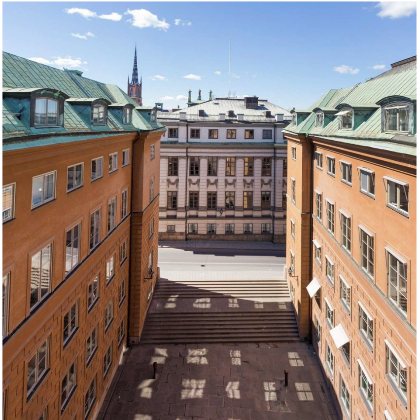
Västra gården före ombyggnaden.