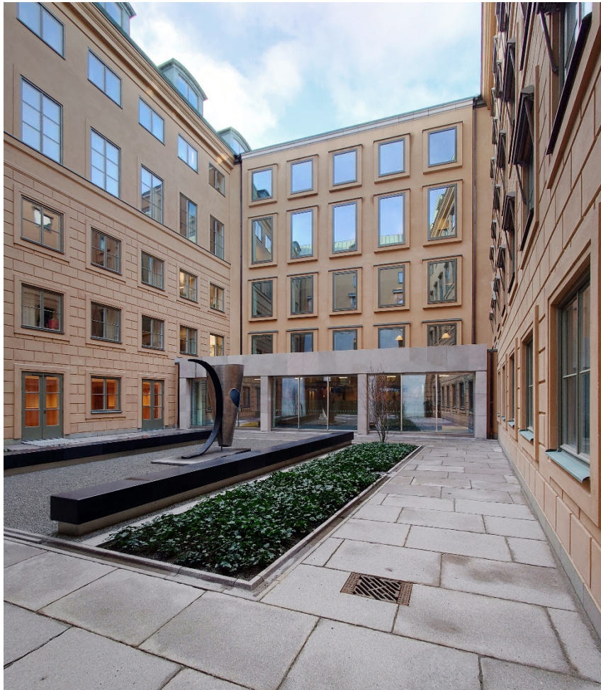
Tillbyggnadens fasad mot västra gården. I suterräng mot gården syns ny hörsal. Foto: Ahrbom och Partner

Mot Rådhusgränd har fasaden mot gatan dragits in för att låta de befintliga flyglarna dominera över hörnen samt synliggöra flyglarnas tak i gatuperspektivet.