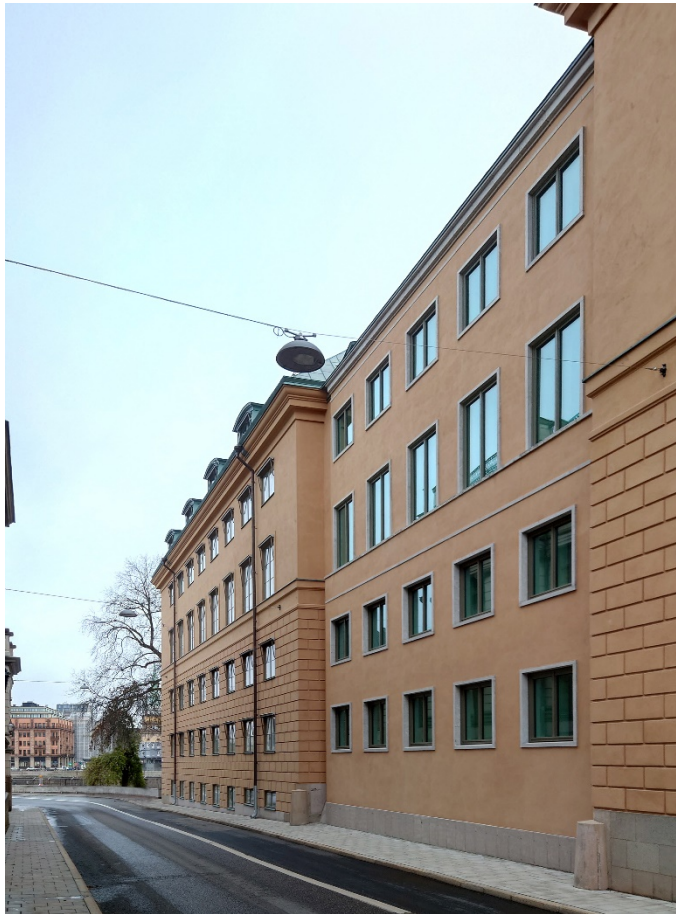
Fasad mot Rådhusgränd. Foto: Ahrbom och Partner

Byggnadens grundläggande syfte har sitt ursprung i de krav som ställs på säkerhet och funktion. Den arkitektoniska idén (PM Arkitektonisk idé, 2023) har varit att hitta en lösning som förvaltar och anpassar sig till helheten men som också är avläsbar som en ny årsring. Den nya, putsade byggnadsdelen har bland annat givits samma varma rödockrakulör som den befintliga byggnaden. Tillbyggnaden ansluter även materialmässigt till flyglarna genom sin granitsockel och sitt koppartak.