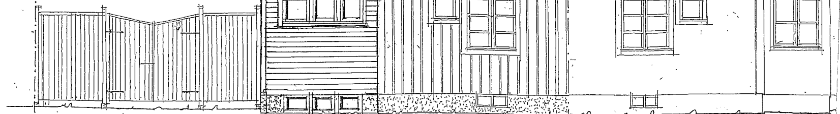
FASAD MOT NORDÖST MOT ULVSUNDAVÄGEN