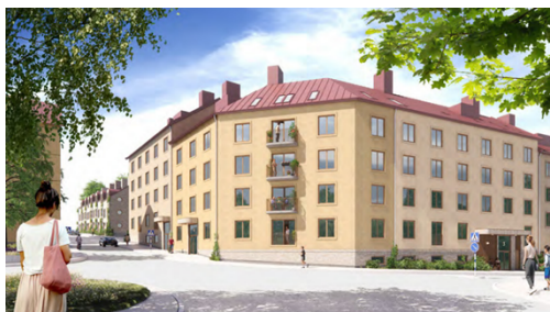
Perspektivbild redovisande föreslagen utformning av ny bebyggelse invid korsningen Erik Segersälls väg – Blommensbergsvägen (delområde B). Bild: Arkitema

utformningsbestämmelse har även först in som innebär att nya byggnader ska utföras med sadeltak. Vid korsningen Blommensbergsvägen – Erik Segersälls väg tillåts föreslaget lamellhus inom delområde B utformas så att det går över hörn i enlighet med bild nedan.