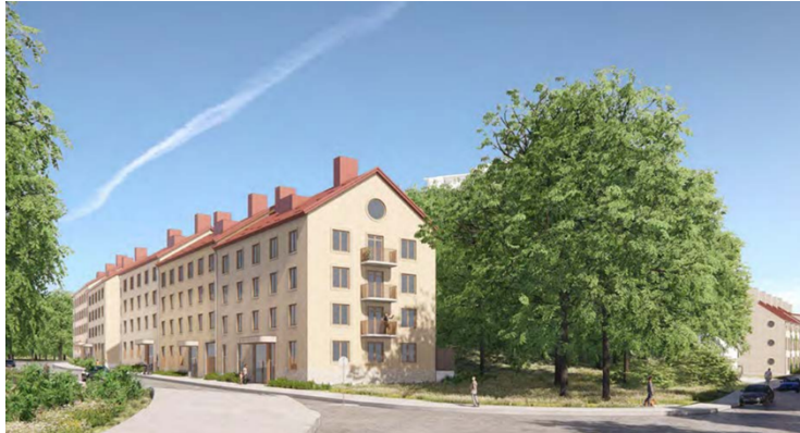
Perspektivbild redovisande föreslagen utformning av ny bebyggelse längs Blommensbergsvägen och Hövdingagatan. Vy mot sydost vid korsningen Hövdingagatan – Blommensbergsvägen. Bild: Arkitema

Ljus puts, tegel och trä dominerar som material för föreslagen bebyggelse samt röda tak, som knyter an till Aspuddens befintliga bebyggelse.