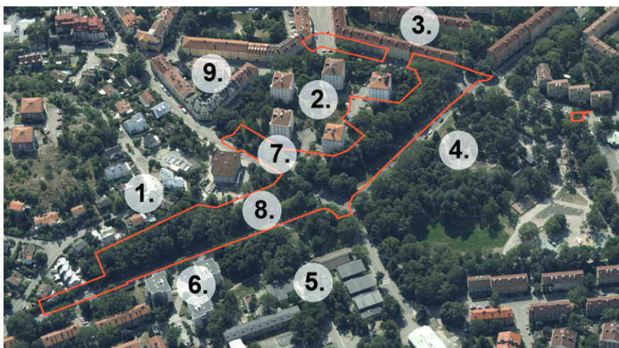
Planområdet sett norrifrån. (1.) Villor i kv. Grågåsen, (2.) Punkthus vid Sverkersgatan, (3.) Lamellhus vid Hövdingagatan, (4.) Aspudsparken, (5.) Aspuddens skola, (6.) Punkthus SKB 90 tal, (7.) Erik Segersälls väg, (8.) Blommensbergsvägen, (9.) Centrala Aspudden. Planområdet markerat med röd linje.

I direkt anslutning till planområdet ligger även Aspuddens skola samt Aspuddsparken. Djurhållande verksamhet bedrivs inom Aspuddsparken i anslutning till planområdet. Förskolor finns i planområdets direkta närhet.