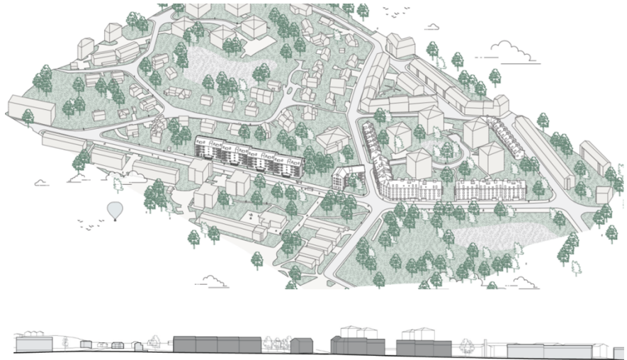
Övergripande modellbild/axonometri redovisande föreslagen bebyggelse inom planområdet (ovan). Längdsektion längs Blommensbergsvägen. föreslagen bebyggelse är markerad med mörkgrå färg (nedan). Bild: DinellJohansson

korsningen Erik Segersälls väg – Blommensbergsvägen skapas ett mindre torg med nya planteringar, träd och sittplatser. Torget ramas in av föreslagen byggnad inom delområde E. I planförslaget ställs krav på att en verksamhetslokal för centrumändamål ska iordningsställas i bottenvåning mot torget.