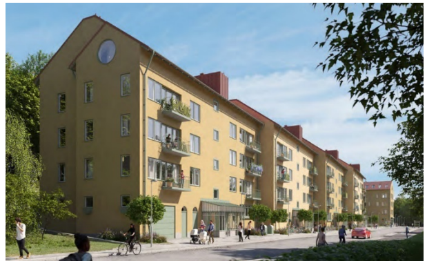
Perspektivbilder redovisande föreslagen utformning av ny bebyggelse inom delområde E (till vänster) och delområde F (till höger). Bild: DinellJohansson