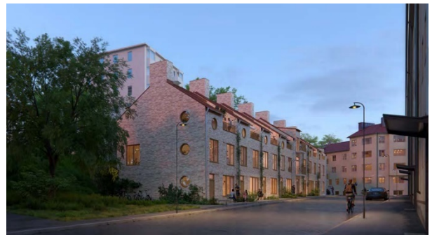
Perspektivbilder redovisande föreslagen utformning av ny bebyggelse inom delområde C (till vänster) och delområde D (till höger). Bild: DinellJohansson