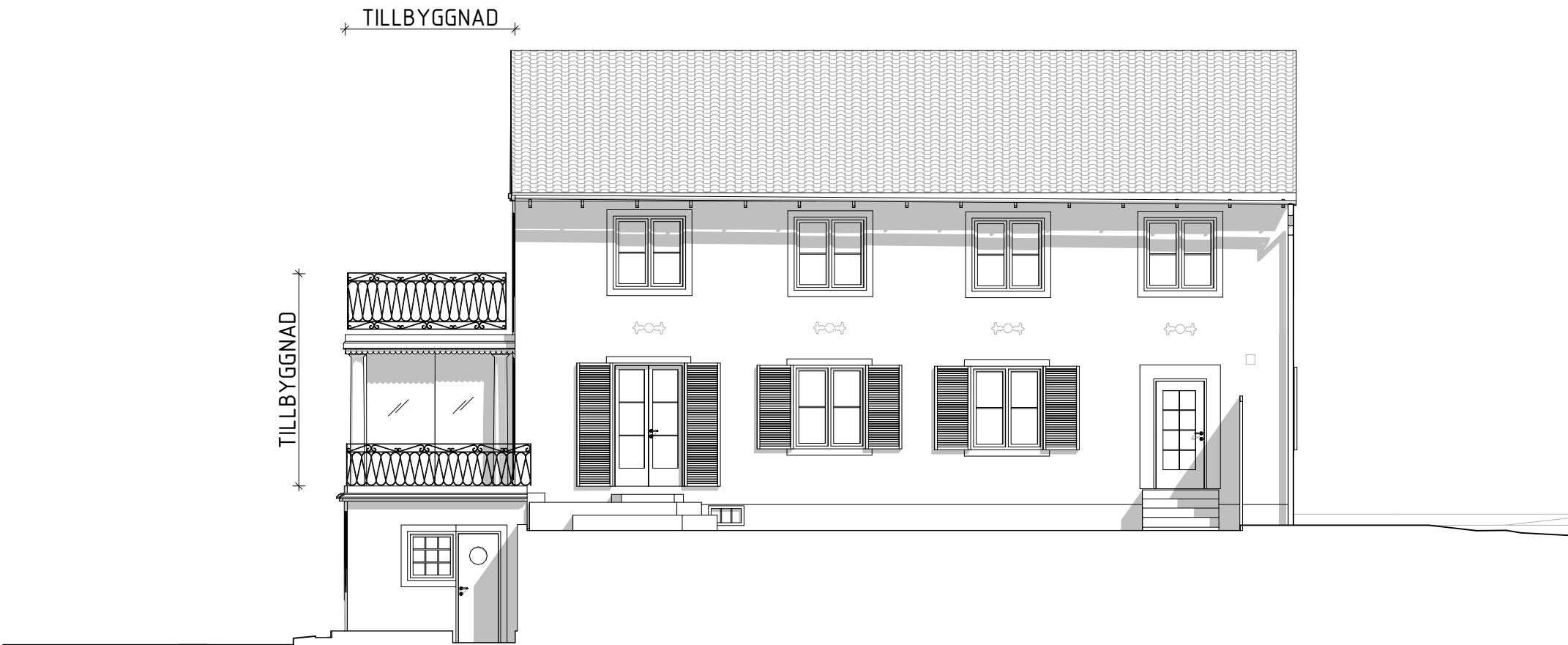
Fasad mot sydost

Alla mått i millimeter. Nya räcken lika befintligt originaljärnräcke i svart smide men utförd för att klara dagens krav i BBR. Vita snidade träpelare till det nya uterummet i tidstypisk stil. Täckande plåt runt uterummets bjälklag i kopparplåt. Skjutdörrar till det nya uterummet i glas utan karmar.