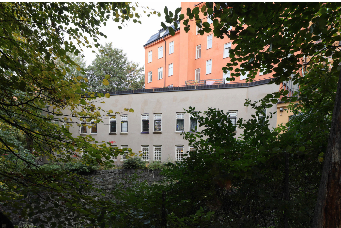
BEFINTLIGT UTSEENDE PÅ SYDVÄSTRA FASADEN SETT FRÅN MOTSTÅENDE SIDA AV JÄRNVÄGSGRAVEN