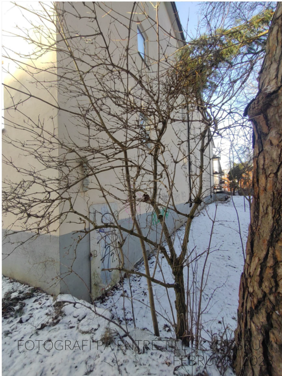
FOTOGRAFI PÅ ENTRÉ TILL SKYDDSRUM FEBRUARI, 2023