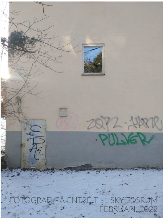
FOTOGRAFI PÅ ENTRÉ TILL SKYDDSRUM FEBRUARI, 2023