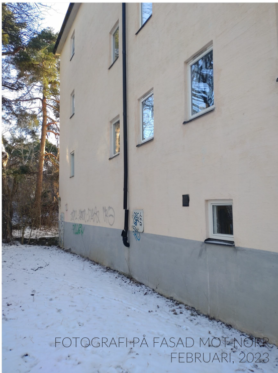
FOTOGRAFI PÅ FASAD MOT NORR FEBRUARI, 2023