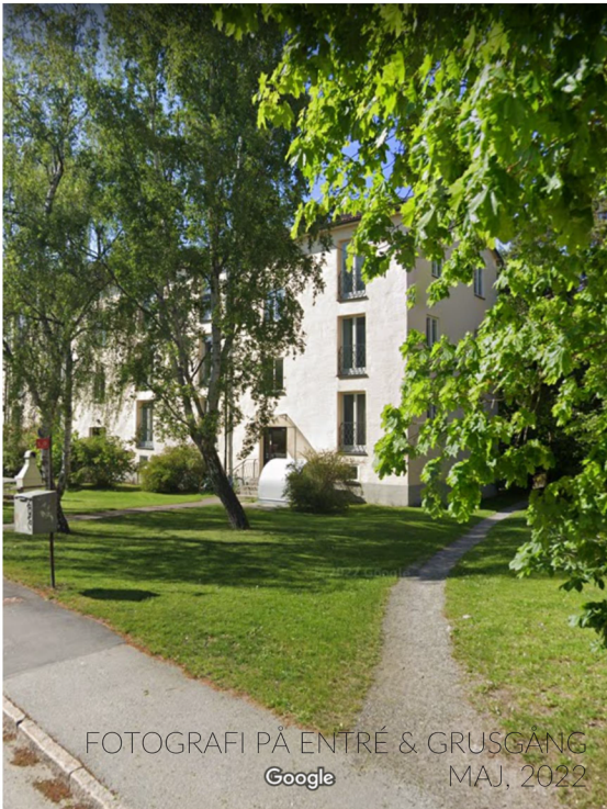
FOTOGRAFI PÅ ENTRÉ & GRUSGÅNG MAJ, 2022