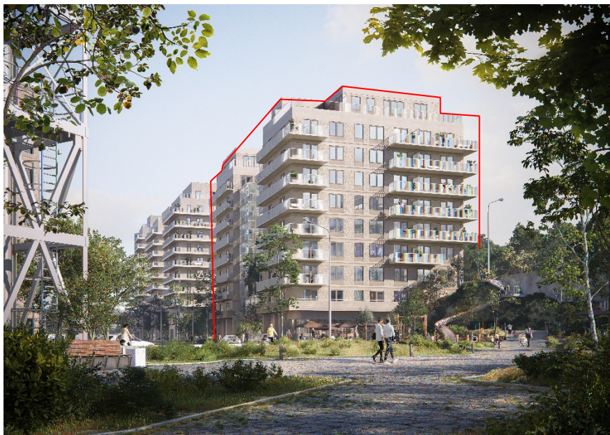
Vy från Gasverksparken österut. Detaljplanen omfattar de två byggnader som markerats med rött. Närmast till vänster det så kallade flamtornet, en bevarad konstruktion från gasproduktionen. Bild: CF Möller Architects

Ett horisontellt motiv av längsgående balkonger ger boendekvaliteter med rymliga uteplatser samtidigt som ljudmiljön i bostäderna förbättras. Översta våningen i varje hus är indragen. Byggnaderna binds samman längs Bobergsgatan av en tydlig sockel med högre våningshöjd, som med publika lokaler och entréer skapar kontakt med gatan. På ömse sidor om kvarteret finns parkstråk med trappor som binder samman de olika nivåerna.