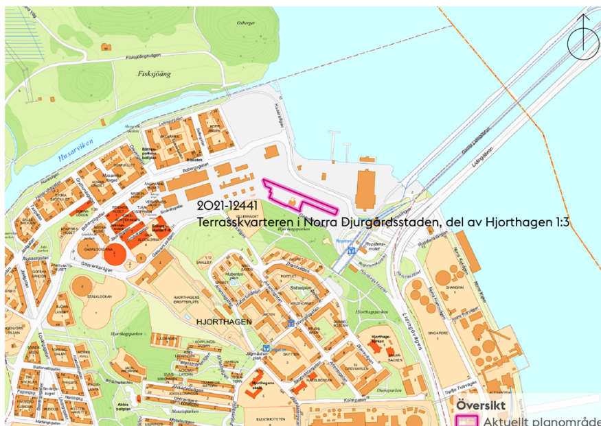
Karta som visar planområdets läge och preliminära avgränsning.