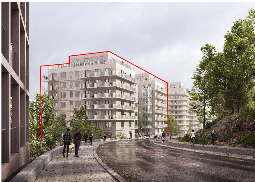
Vy från Gasverksvägen österut. Detaljplanen omfattar de två byggnader som markerats med rött. Närmast till vänster en av de planerade nya byggnaderna inom Gasverket Östra. Bild: CF Möller Architects

Terrasskvarteren utgörs av en grupp byggnader (varav detta tjänsteutlåtande behandlar den västra delen med de två byggnaderna närmast gasverket) på en smal markremsa med stor nivåskillnad mellan Bobergsgatan och Gasverksvägen. De bildar en övergång mellan den kommande bebyggelsen på Kolkajen och den äldre bebyggelsen och grönskan på Hjorthagsberget. Med 10 våningar, som ansluter till planerade byggnader inom gasverket, kommer byggnaderna att utgöra en del av en fond till Kolkajen. Likt övriga byggnader längs Hjorthagsbergets fot skapar de en öppen struktur som låter bergets grönska vara synlig i stadslandskapet. Längs Gasverksvägen skapas tillsammans med ny bebyggelse i Gasverket Östra en serie av solitära huskroppar som landar i mer samlade volymer på den lägre nivån.