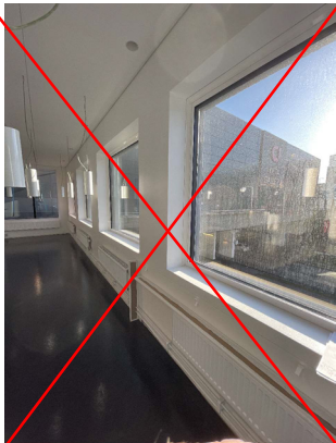
Bild, Invändigt Fasad 2

Fasad 1 Glasparti med invändig karmbredd ca 50 mm. Utvändig mjukfog i vertikal glasskarvar, måttsättning är ej säkerställd. Fasad 2 Fönsterpartier, måttsättningen visar invändigt nischmått. Fönsterkarmar är ca 50 mm.