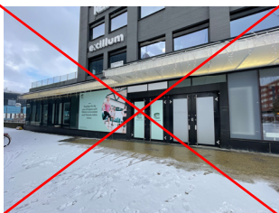
Bild, Fasad 1