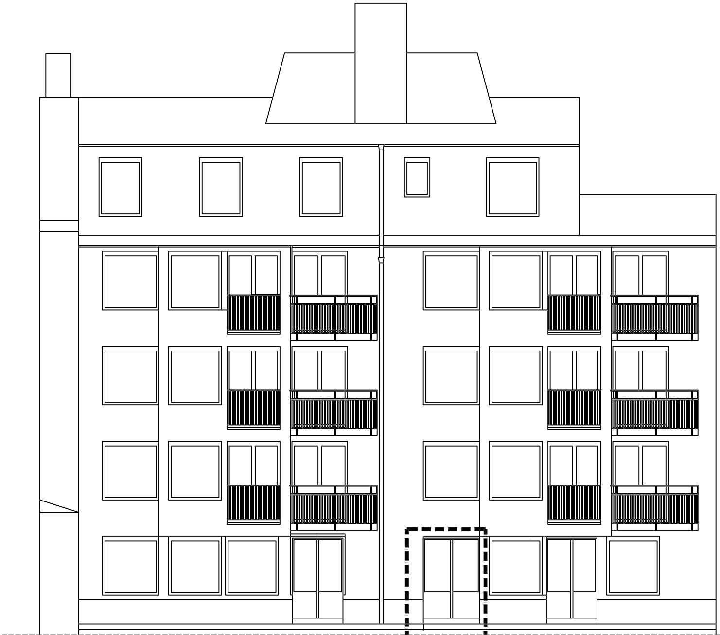
FASAD MOT NORDVÄST BEFINTLIGT UTSEENDE