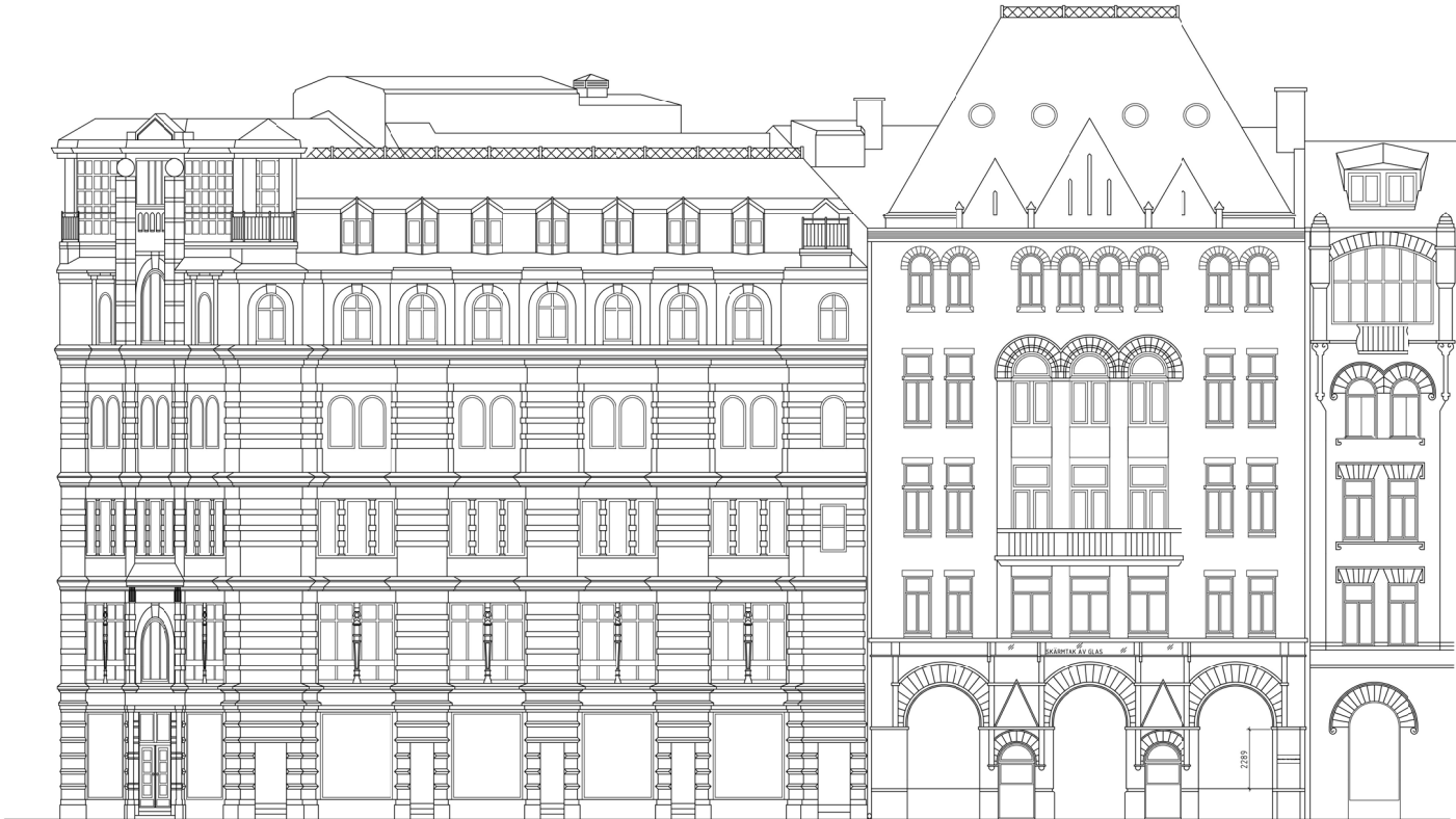
FASAD MOT BIRGER JARLSGATAN