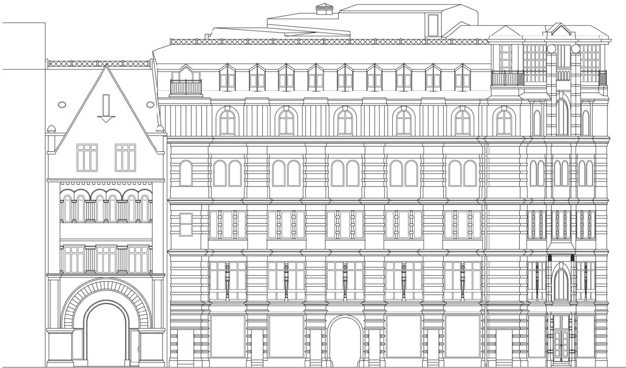
FASAD MCT SMÅLANDSGATAN

VIND 6 TR 5 TR 4 TR 3 TR 2 TR 1 TR ENTRESOL ENTRÉ KÄLLARE 1