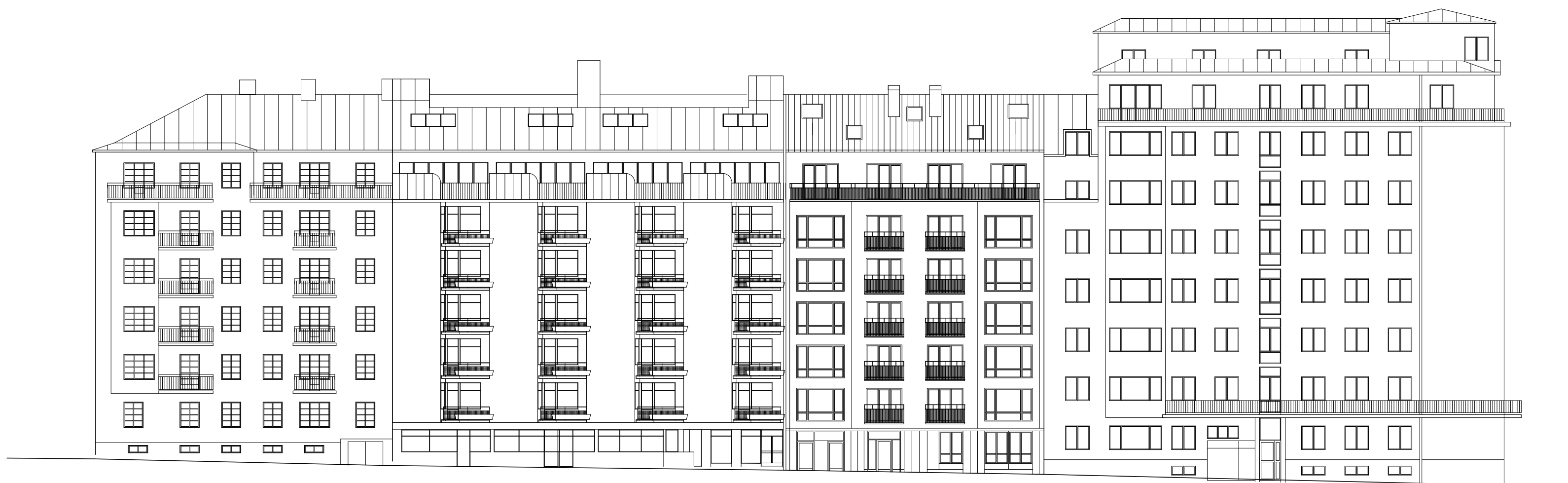
FASAD JOHN ERICSSONSGATAN MED OMGIVNING

Utvändig material - och kulörbeskrivning