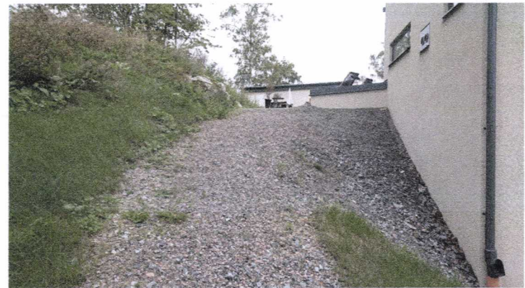
Otillgänglig slänt mot nedre delen av trädgården, dagvattnet leds in mot fasad.