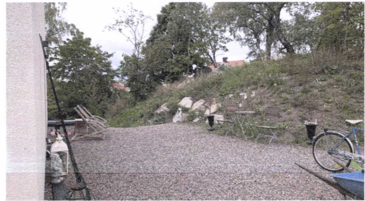
Befintlig kulle av schaktmassor och stenblock.

STOCKHOLMS STAD Stadsbyggnadskontoret Inkom 2024-04-17 Reg. Dnr: 2024-05999