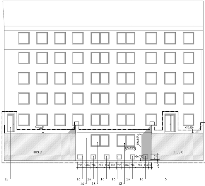
GÅRDSFASAD - HUS B

FÖRKLARINGAR MÅTT ANGES I MILLIMETER PLUSHÖJDEN ANGES I METER OCH AVSER FÄRDIG YTA DÅR E.J. ANNAT ANGES: HÖJDSÄTTNING ENL. GAMLA SYSTEMET FRÅN BYGGLOVET 1967 ----- BYGGLOVET AVSER