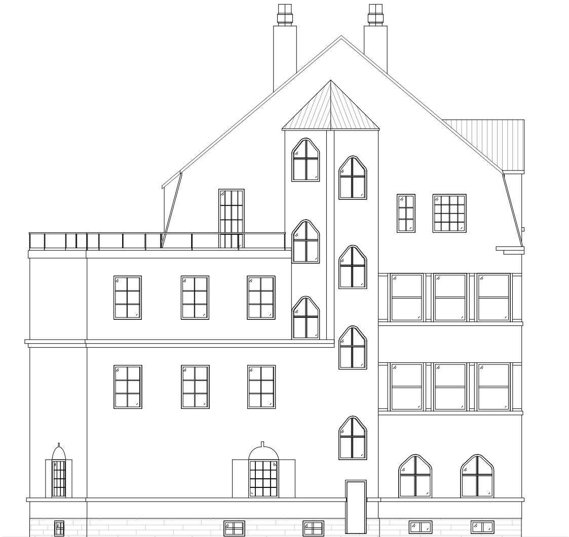
1 FASAD MOT NORDVÄST 1 : 150