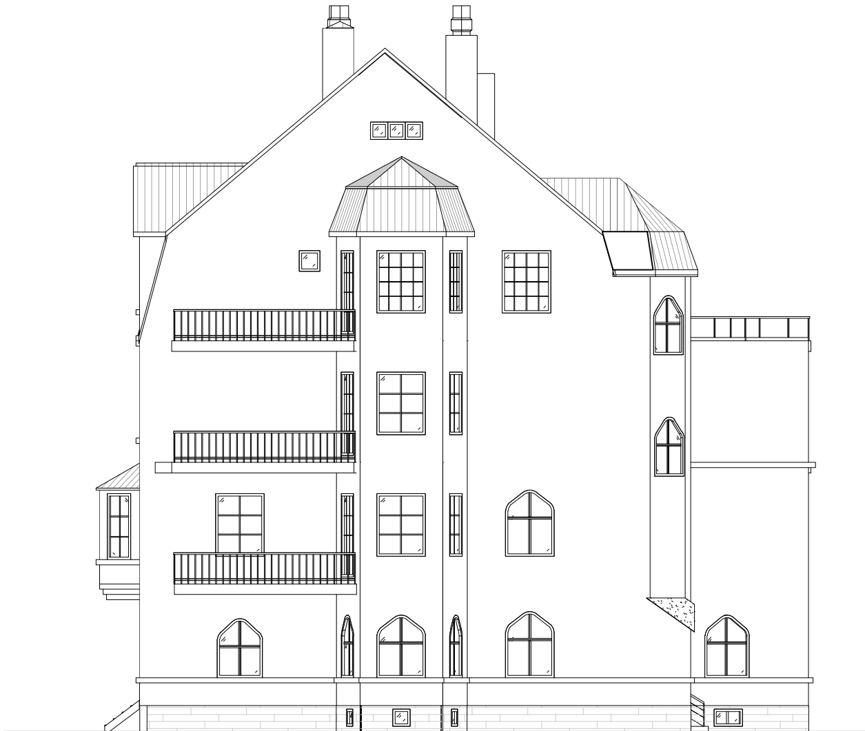
2 FASAD MOT SYDÖST 1 : 150

Tillhör Stockholms stadsbyggnadsnämnds beslut, Lovbeslut - Bifall - 2024-04-04, Handl. Cecilia Ericson Montgomery