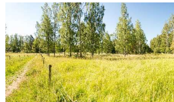
Ängsmark i Sätraskogens naturreservat