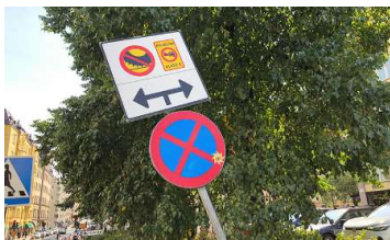
Dubbdäcksförbud och miljözon