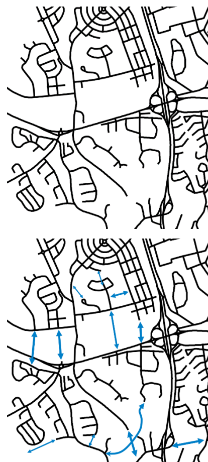
Figur 2. Principskiss över isolerade gatustrukturer och potentialen i att koppla samman med flera länkar.