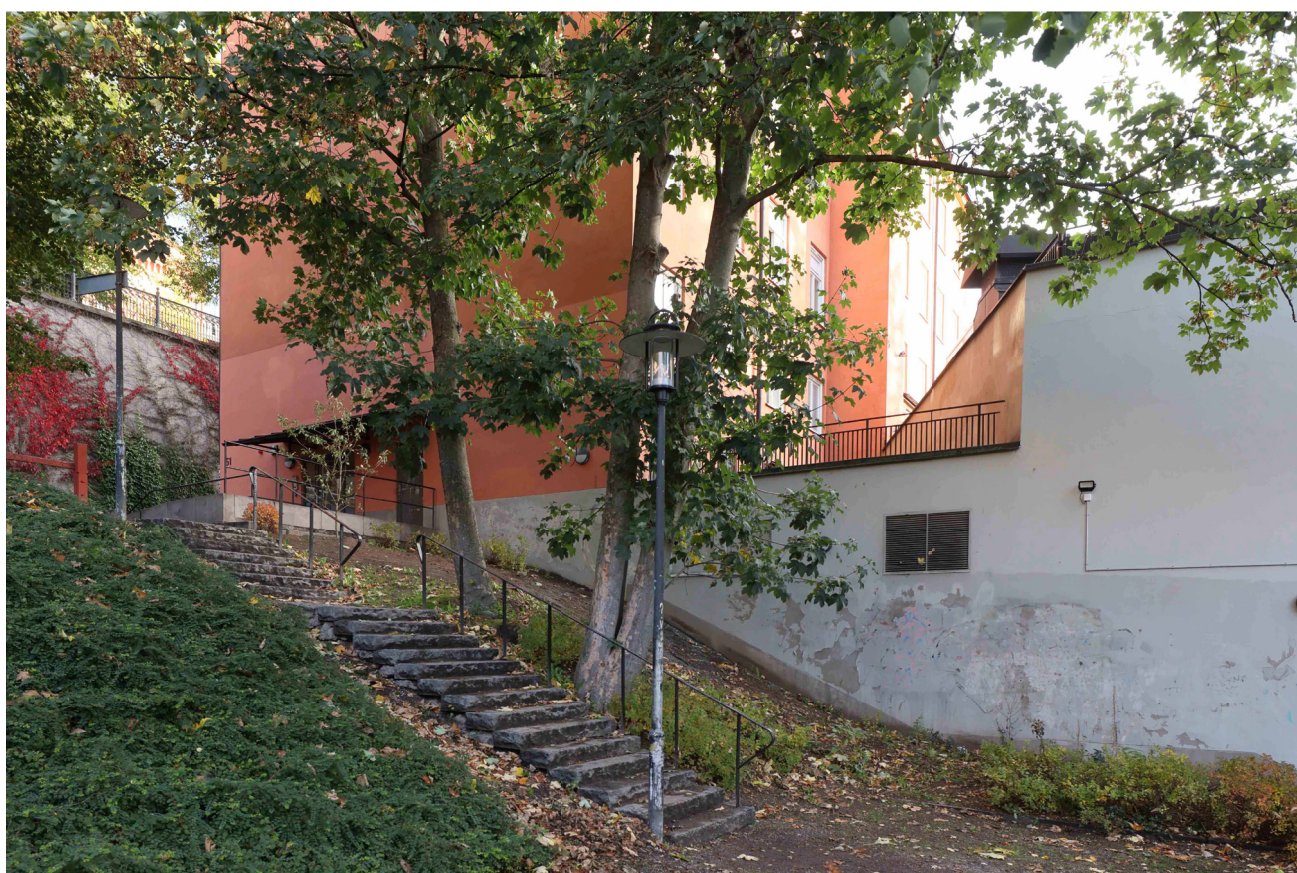
BEFINTLIGT UTSEENDE PÅ VÄSTRA FASADEN SETT FRÅN PARKEN