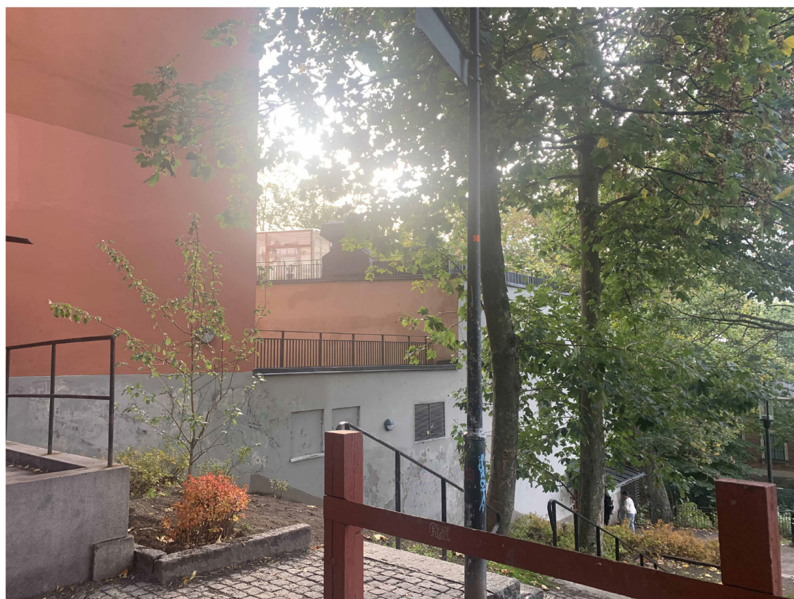
BEFINTLIGT UTSEENDE PÅ VÄSTRA FASADEN SETT FRÅN GATA