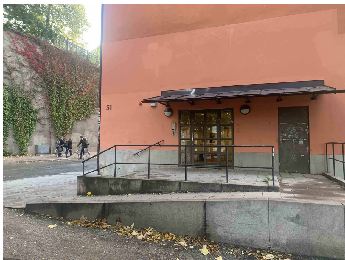
BEFINTLIGT UTSEENDE PÅ BEFINTLIG HUVUDENTRÉ, SKÄRMTAK OCH RAMP