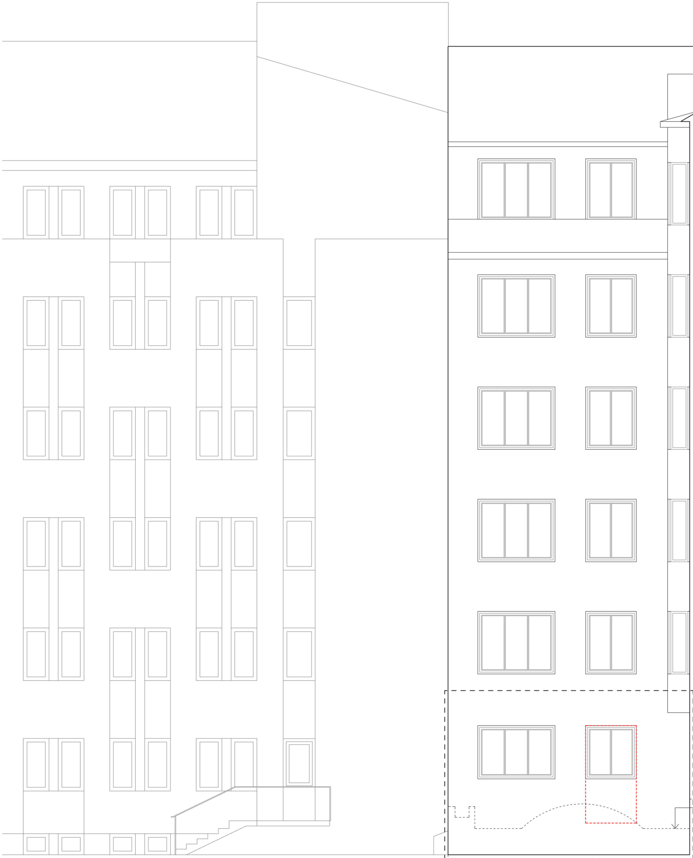
Befintlig fasad mot öster