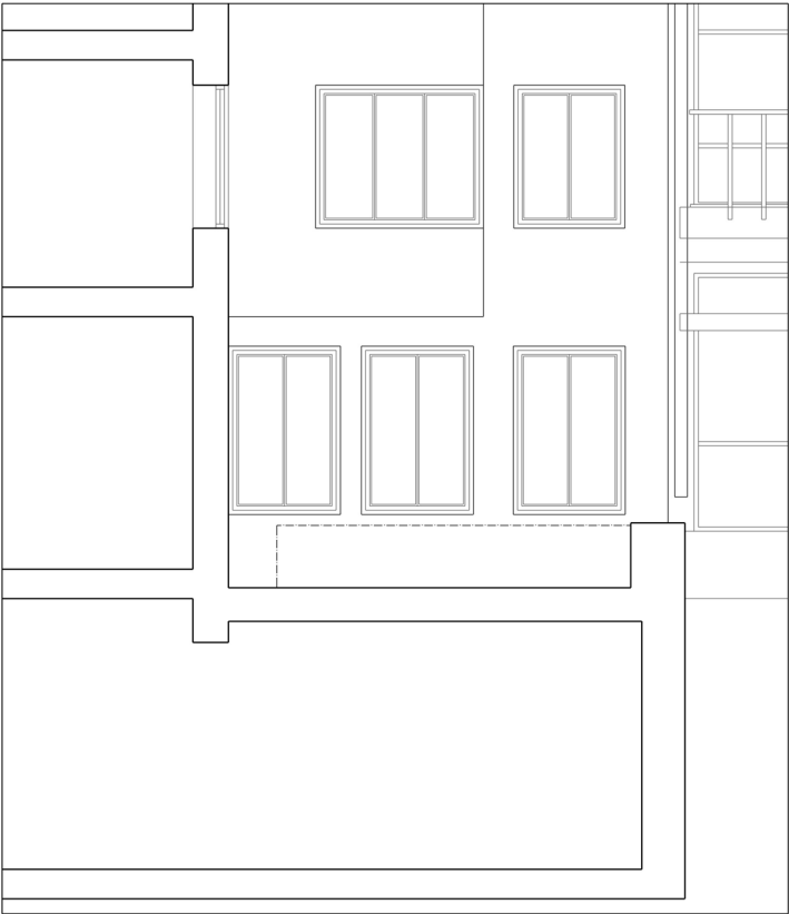
Sektion B-B, Befintligt