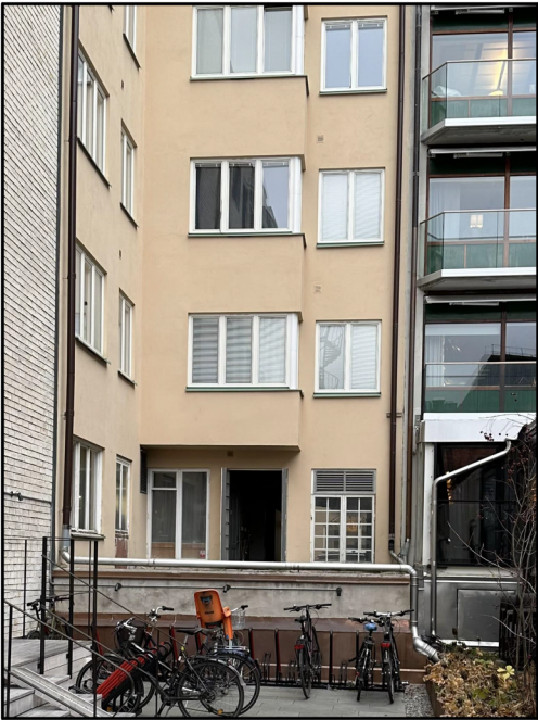
Bild från grannfastighetens gård

Nuläge / Bakgrund Befintlig otillgänglig gårdsyta med igensatt lanternin till garage. Lanterninen och tätskiktet till garaget skapar idag fuktproblem.