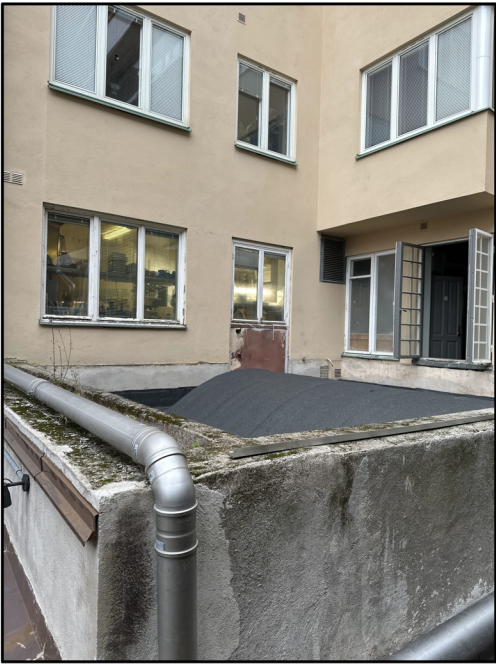
Bild befintlig fasad och gård med igensatt ovanljus och igensatt dörr.

Genom tillbyggnad av ny paviljong skapas samtidigt ett nytt tätskikt för garaget.