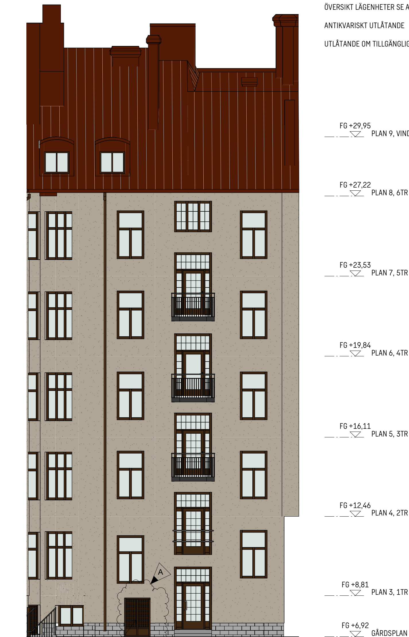
FASAD MOT NORDOST

NYTT VENTILATIONSGALLER STORLEK LIKA BEF. TÅT ÖPPNING