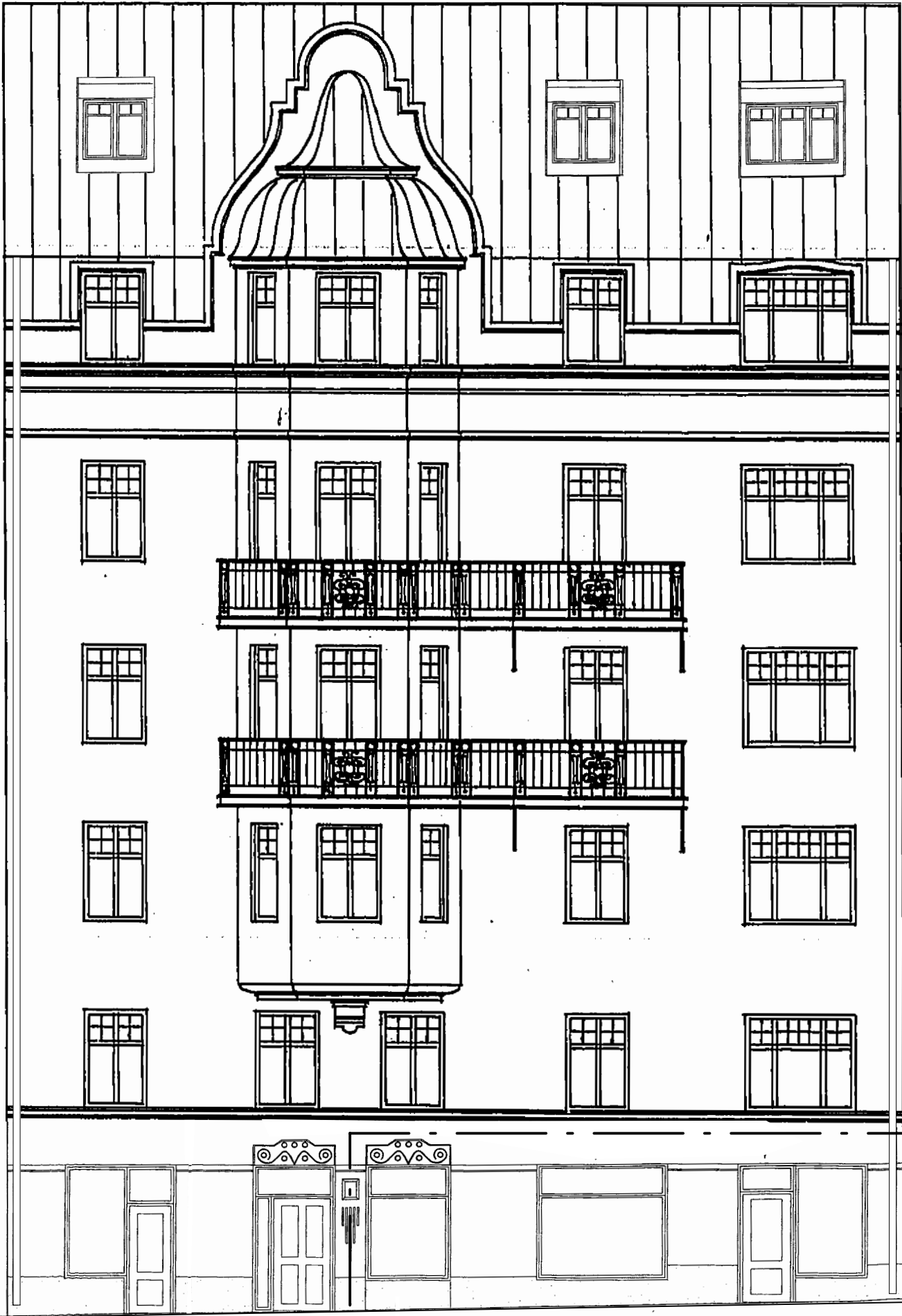
FASAD MOT GATA SKALA 1:100 (A3)

LIKA BEFINTLIGT, INGEN ÅTGÄRD I FASAD (UTFÖRANDE ENL BEVILJAT BYGGLOV DNR 2012-06548-575)