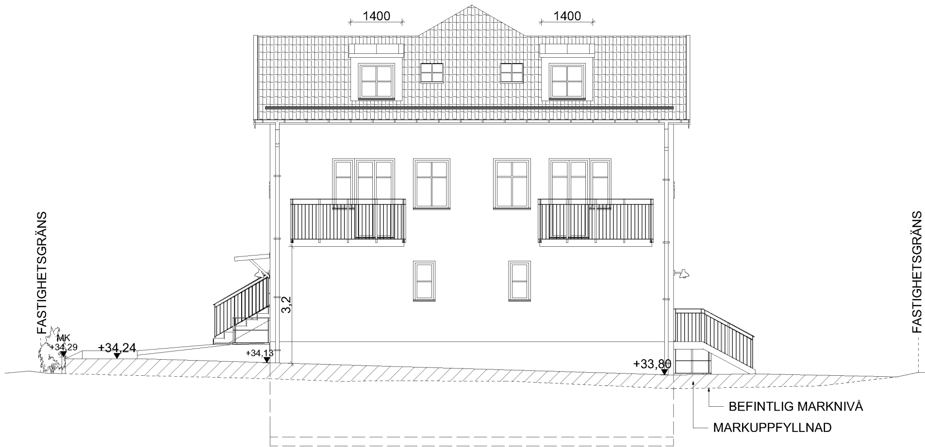
FASAD A4 MOT VÄSTER

Inkom till Stockholms stadsbyggnadskontor - 2022-12-16, Dnr 2022-03884 Tillhör Stockholms stadsbyggnadsnämnds beslut, Lovbeslut - Bifall - 2024-02-22, Handl. Sandra Wennerberg