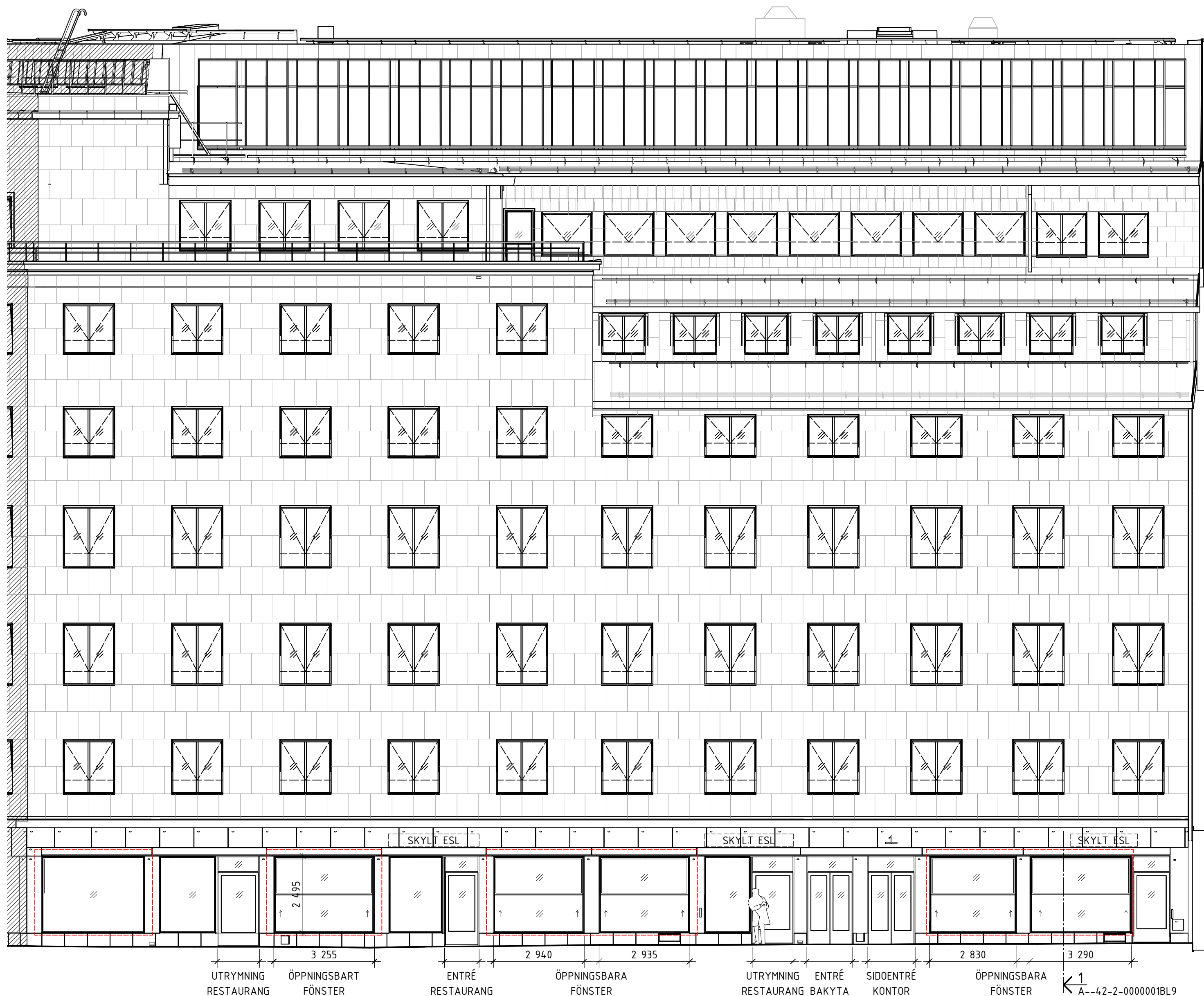
FASAD MOT GREV TUREGATAN