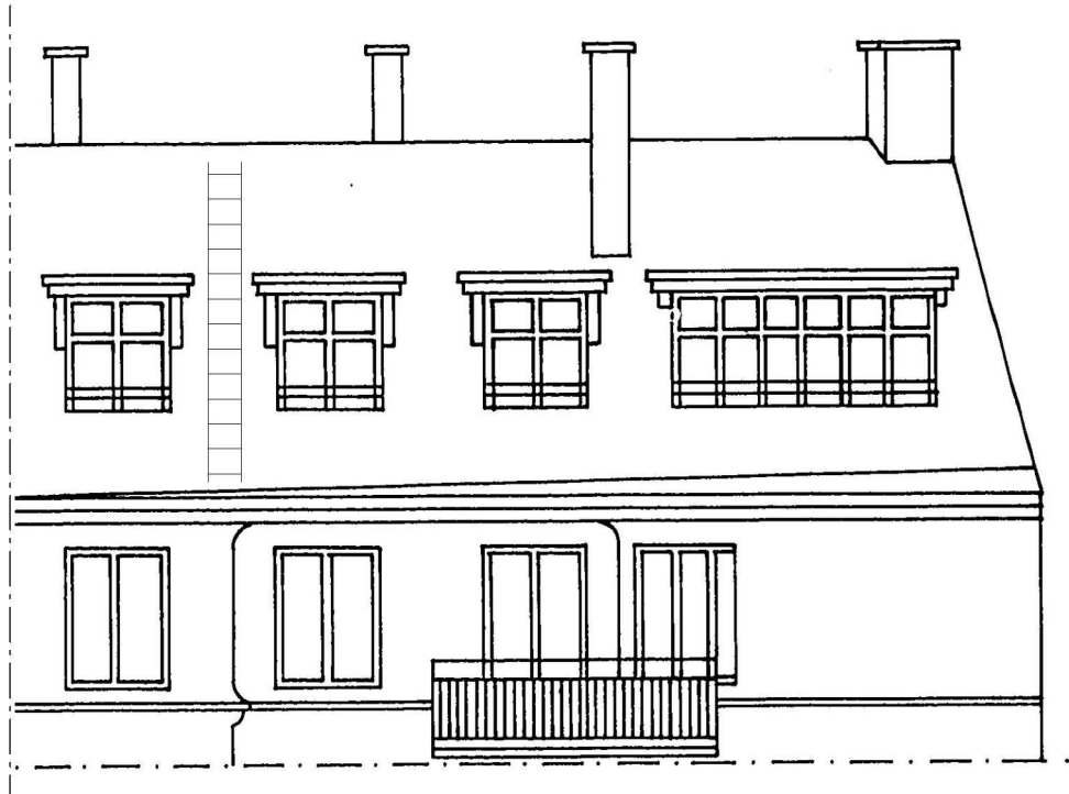
FASAD MOT SÖDER - BEFINTLIGT (UTSNITT)