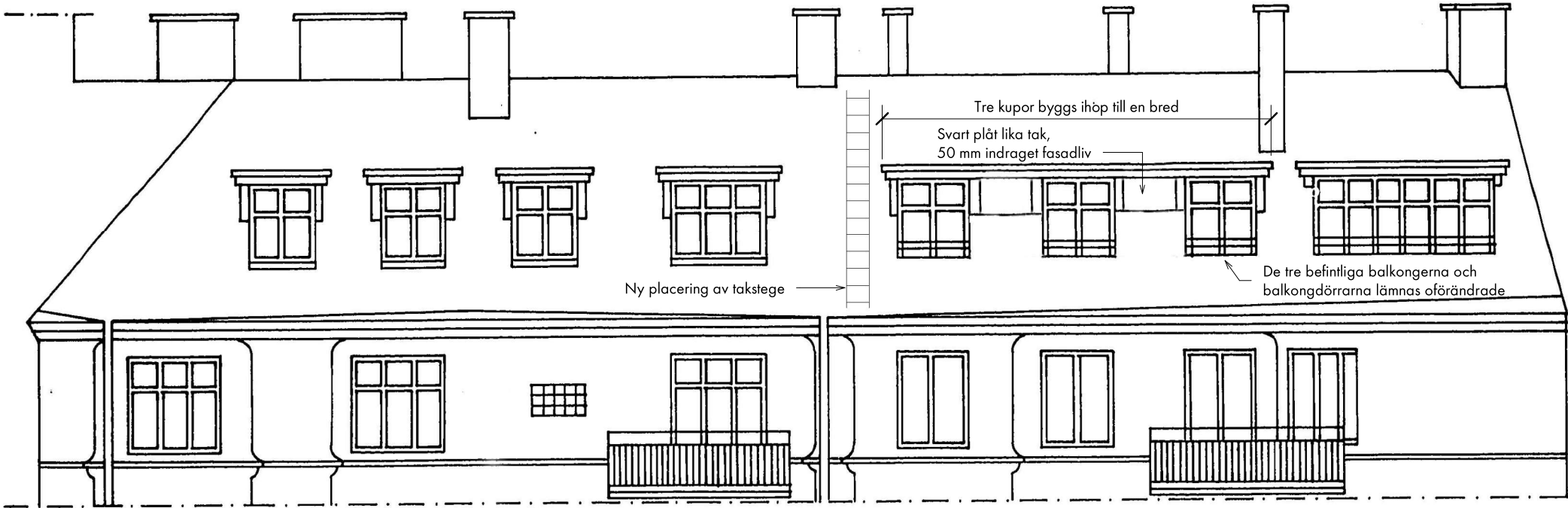
FASAD MOT SÖDER - NYTT