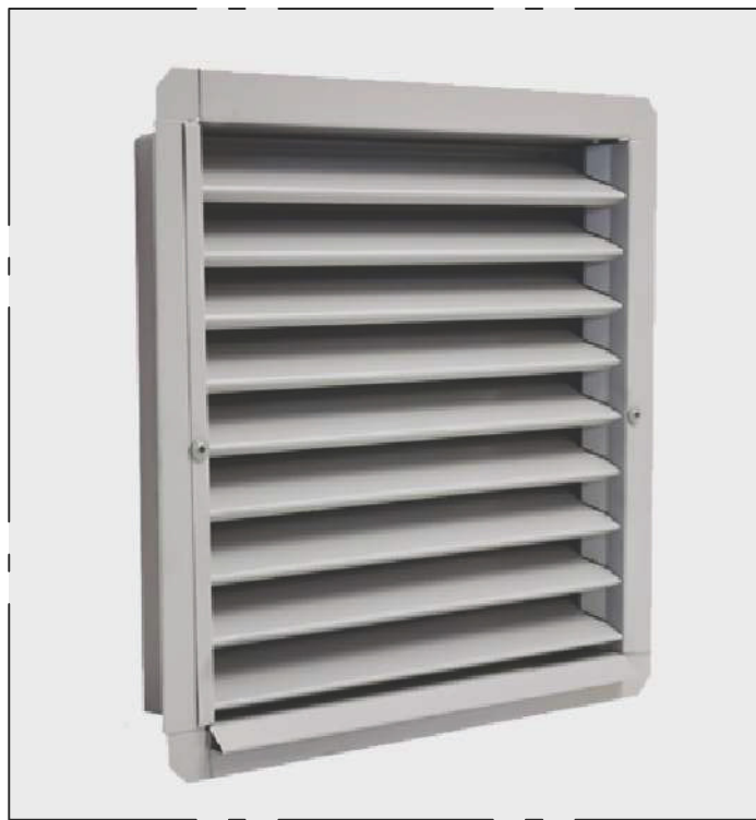
FABRIKATUTSEENDE (FEL FÄRG)

Ritningen avser att redovisa nya ventilationsanpassningar enligt ritning.