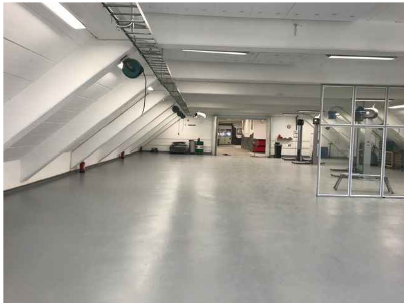
Befintlig Plan 1 trappa