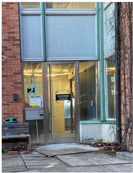
BEFINTLIGT DÖRR- OCH FÖNSTERPARTI

- TRAPPA M RAMP TRAPPA AV BETONG UTVIDGAS NÅGOT OCH FÖRSES MED TILLGÅNGLIGHETSRAMP.