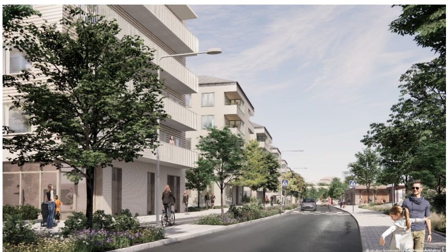
Bild som visar föreslagen bebyggelse längs gårdets norra kant, Nytorpsbadet och gatans utformning. Bild: Bergkrantz Arkitektur.

För att angöra den nya bebyggelsen och badet föreslås två nya lokalgator. Gatorna placeras framför den nya bebyggelsen för att skapa tydliga gränser mellan offentligt och privat samt för att värna en grön zon mellan befintlig och ny bebyggelse. Gatusektionen längs gårdets norra kant har minimeras och utformats för att prioritera gång- och cykeltrafik, innehålla mycket grönska och för att tydligt motverka genomfartstrafik.