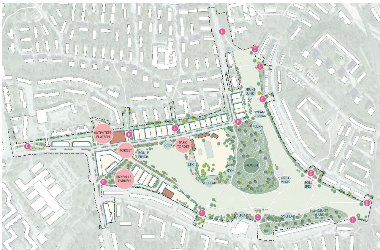
Illustrationsplan som visar föreslagen programmering av allmän plats på Nytorps gärde. Bild: Landskapslaget.

Nytorps gärde utvecklas som en stadsdelspark med tydliga offentliga miljöer och fler aktiviteter. Flera nya mötesplatser föreslås med varierad utformning och innehåll för att erbjuda en mångfald av rum.