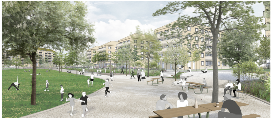
Bild som visar föreslagen utformning av parktorget med ny bebyggelse i bakgrunden. Bild: Landskapslaget.