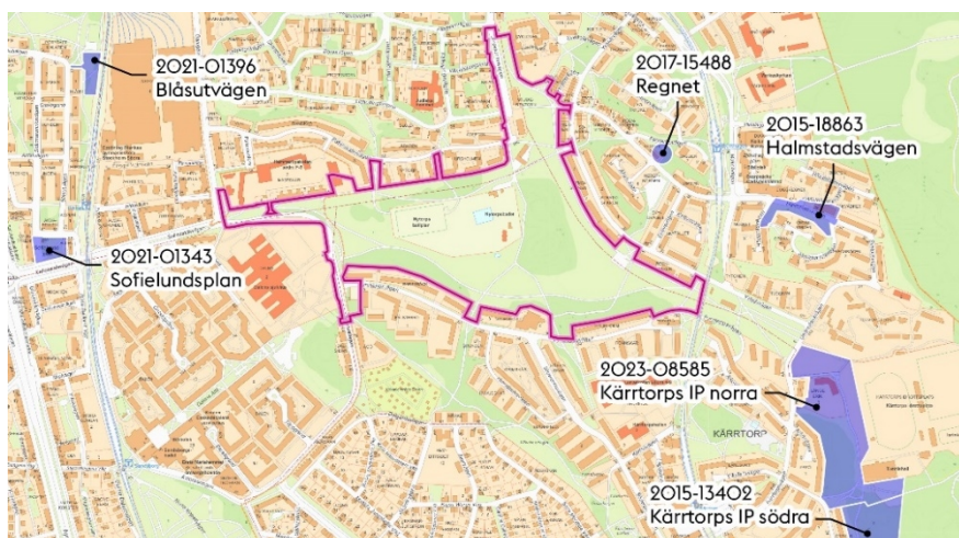
Karta som visar planområdets läge och preliminära avgränsning (rosa) samt pågående detaljplaner i närområdet (blått).

Planområdet ligger norr om Kärrtorp, söder om Hammarbyhöjden, väster om Björkhagen och öster om Dalen. Planområdet tillhör till största del Kärrtorps stadsdel, en mindre del tillhör Hammarbyhöjden, Björkhagen och Gamla Enskede. Planområdet är cirka 22 hektar.