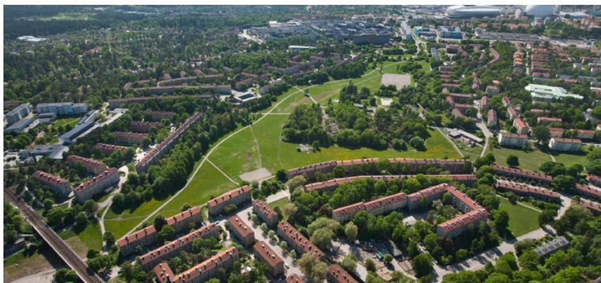
Flygbild över området från öst mot väst.

Nytorps gärde består främst av öppna marker i form av gräsmattor, fotbollsplaner och Nytorpsbadet. Centralt i området ligger en kulle med tallskog, stenhällar och skogsbyn med mycket lövträd. Delar av Nytorps gärde som har Högt naturvärde eller Påtagligt naturvärde är lokaliserade till skogspartiet på kullen och till gårdets kanter. Nytorps gärde ingår inte i några habitatnätverk eller ekologiskt särskilt betydelsefulla områden (ESBO).