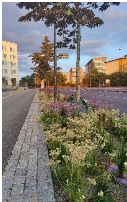
Referensbild för plantering i en trädzon från Värmdövägen i Nacka.