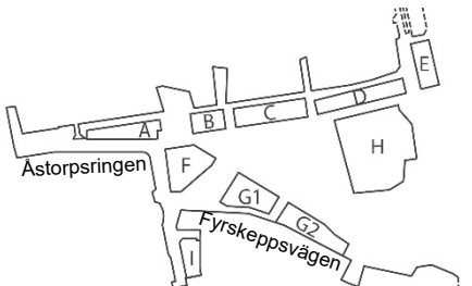
Orienteringsbild med kvartersnamn.

parkrummet för att skapa ett gemensamt bebyggelsegrepp med kvarter C och D.