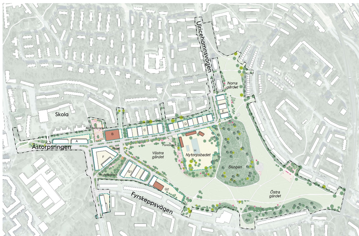
Illustrationsplan som visar föreslagen utformning av allmän plats och bebyggelse på Nytorps gård. Bild: Landskapslaget.