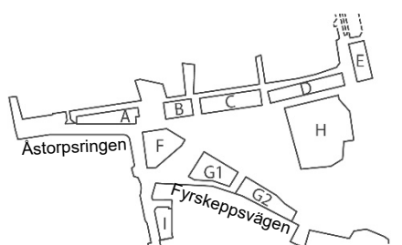
Orienteringsbild med kvartersnamn.

Stadsmuseet har pekat ut Björkhagen, norra Hammarbyhöjden samt Kärrtorp inklusive Nytorps gård som särskilt kulturhistoriskt intressanta områden. Dessa områden representerar en viss tids stadsbyggnadshistoria och arkitekturhistoriska ideal väl.