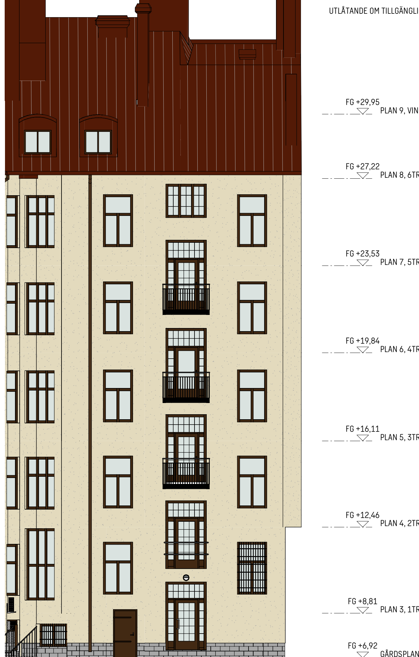
FASAD MOT NORDOST - BEFINTLIGT