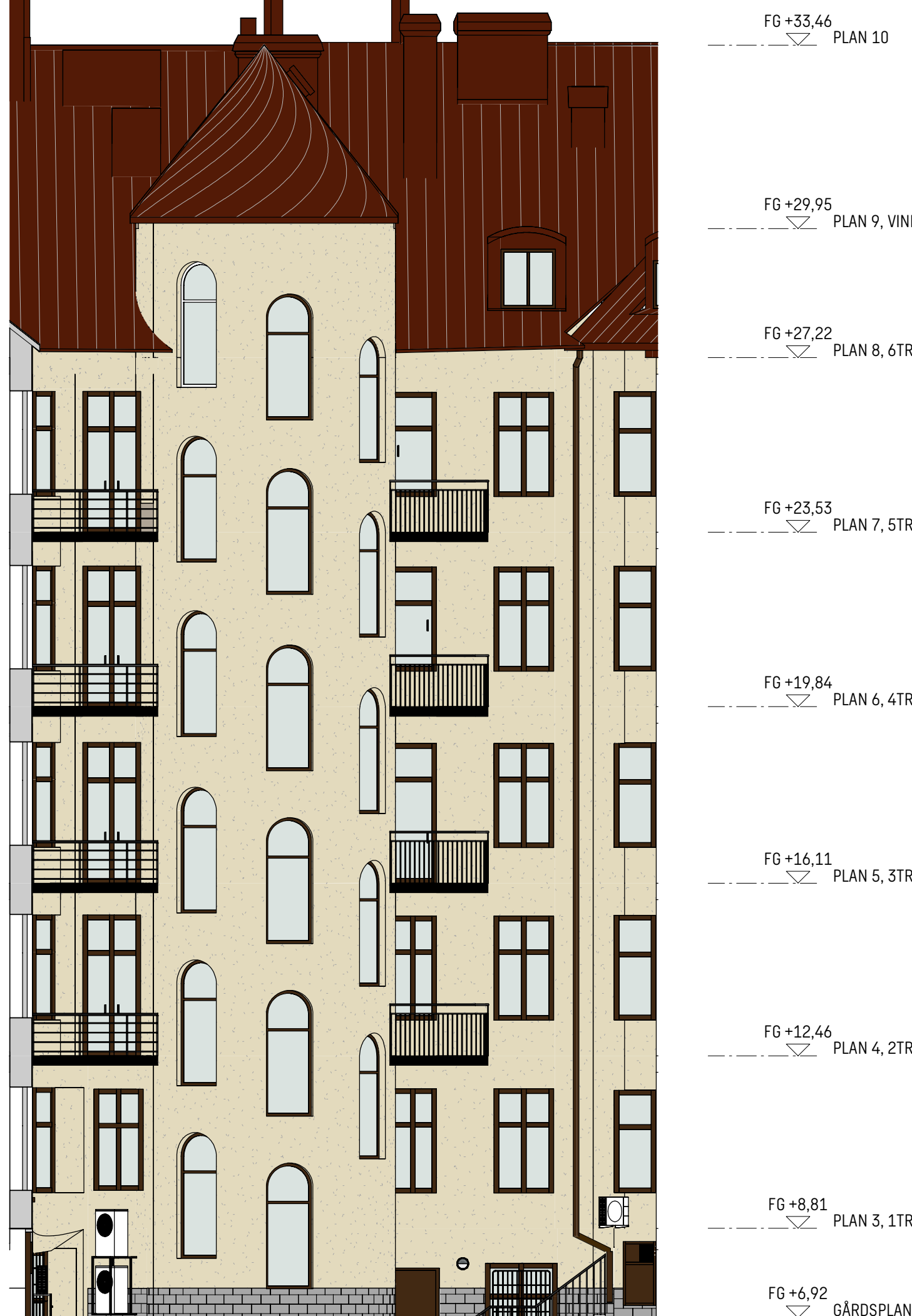
FASAD MOT NORR - BEFINTLIGT