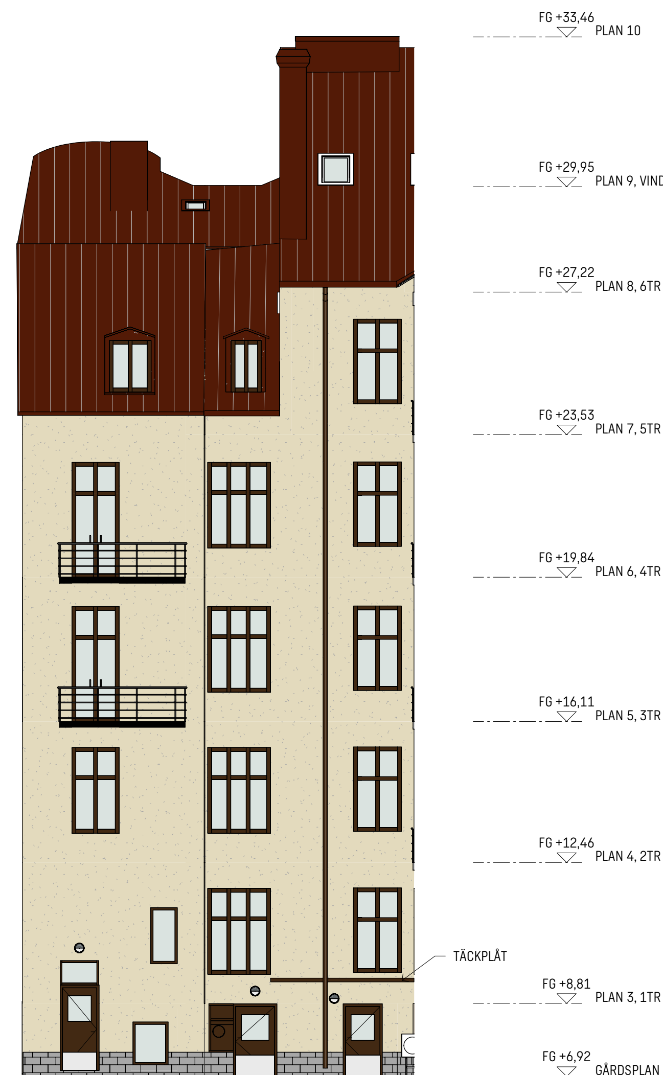
FASAD MOT VÄSTER - BEFINTLIGT