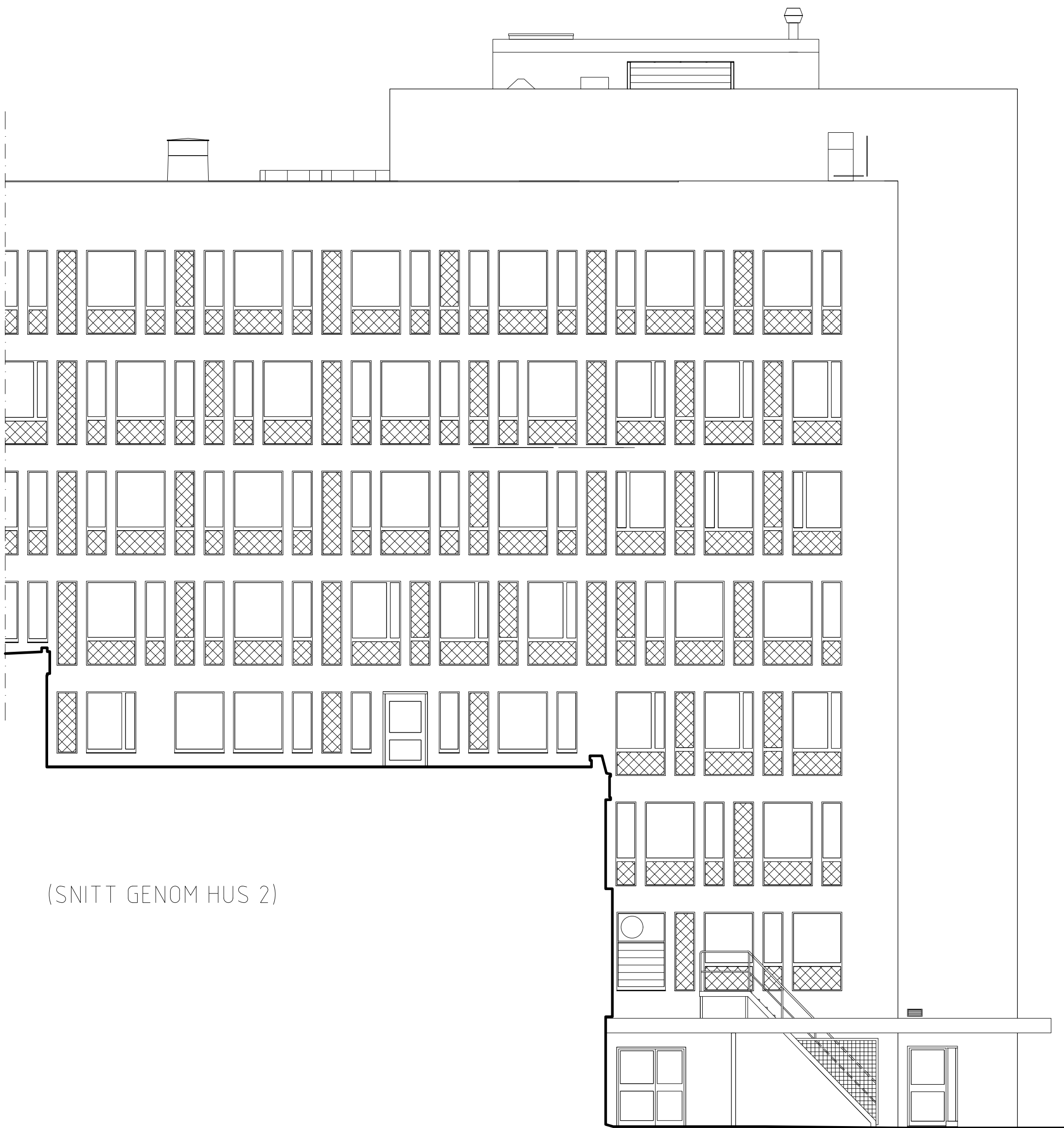
(SNITT GENOM HUS 2)