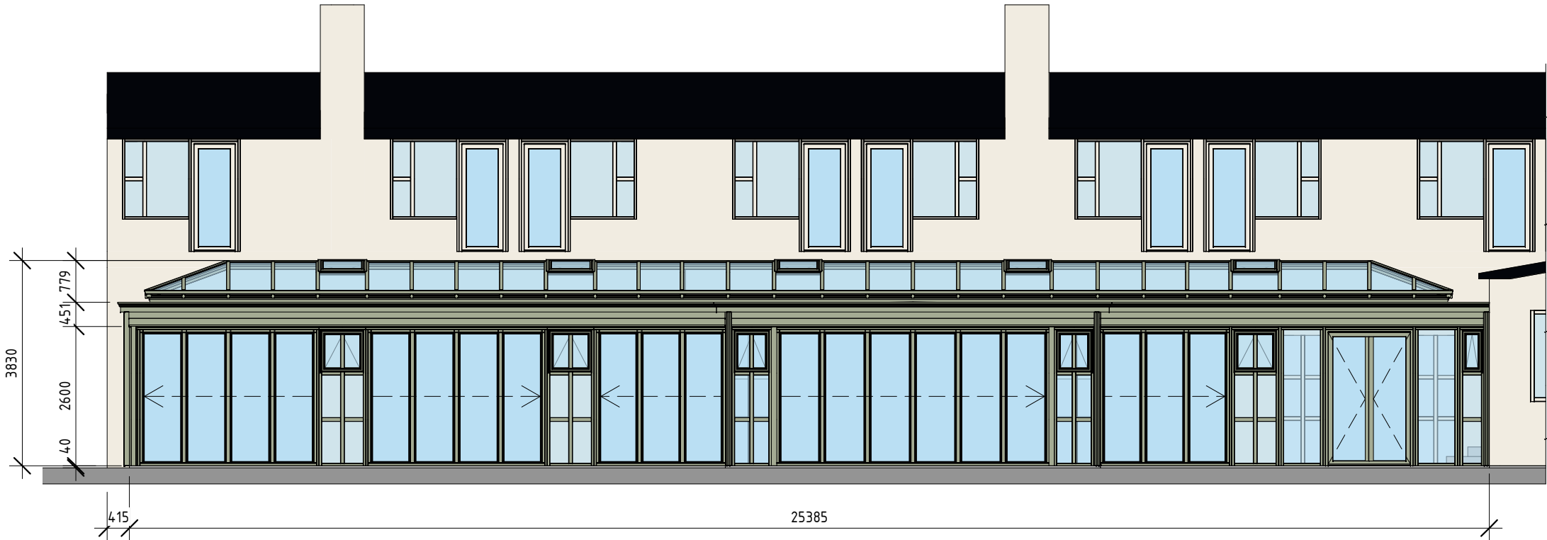
Fasad mot sydväst ( 1 : 100)