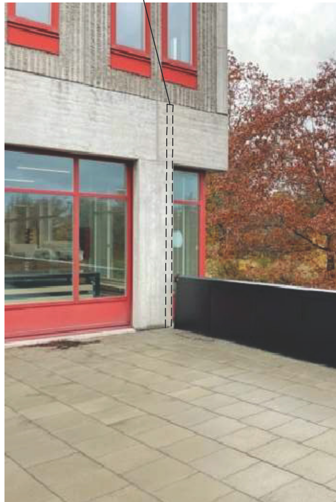
Bullerskärm placeras innanför balustrad/räcke