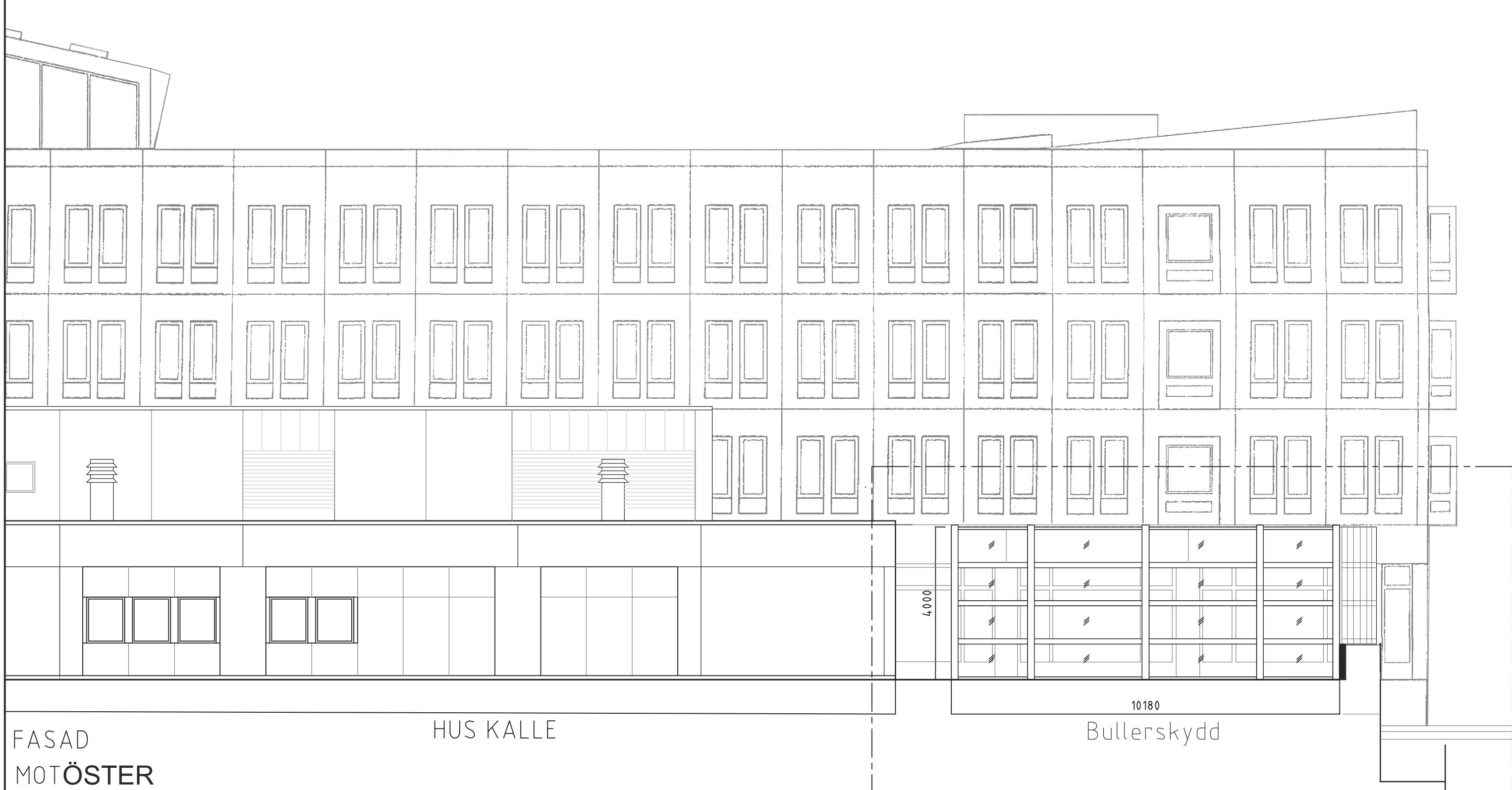
FASAD MOT ÖSTER HUS KALLE