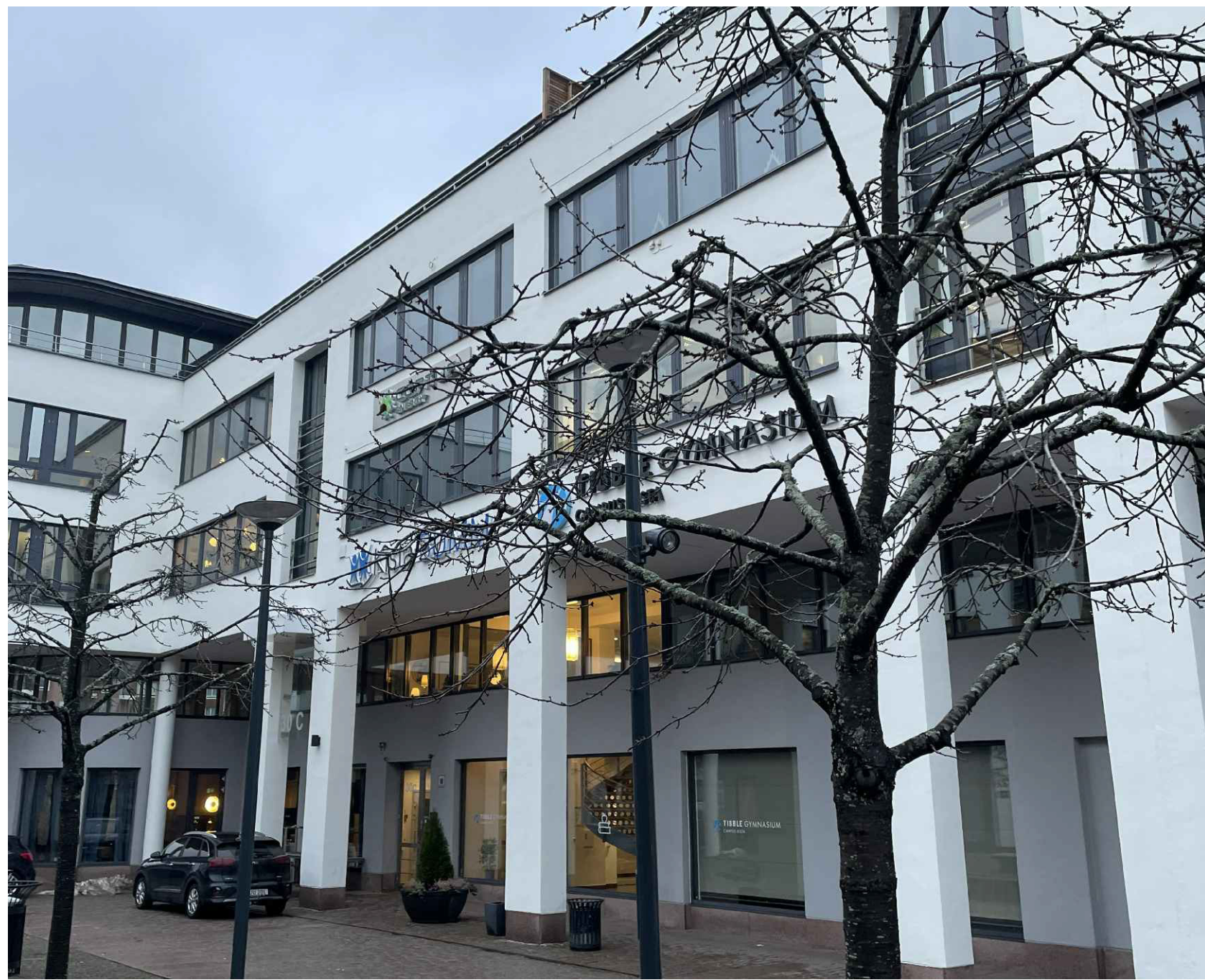
FOTO - NUVARANDE SITUATION