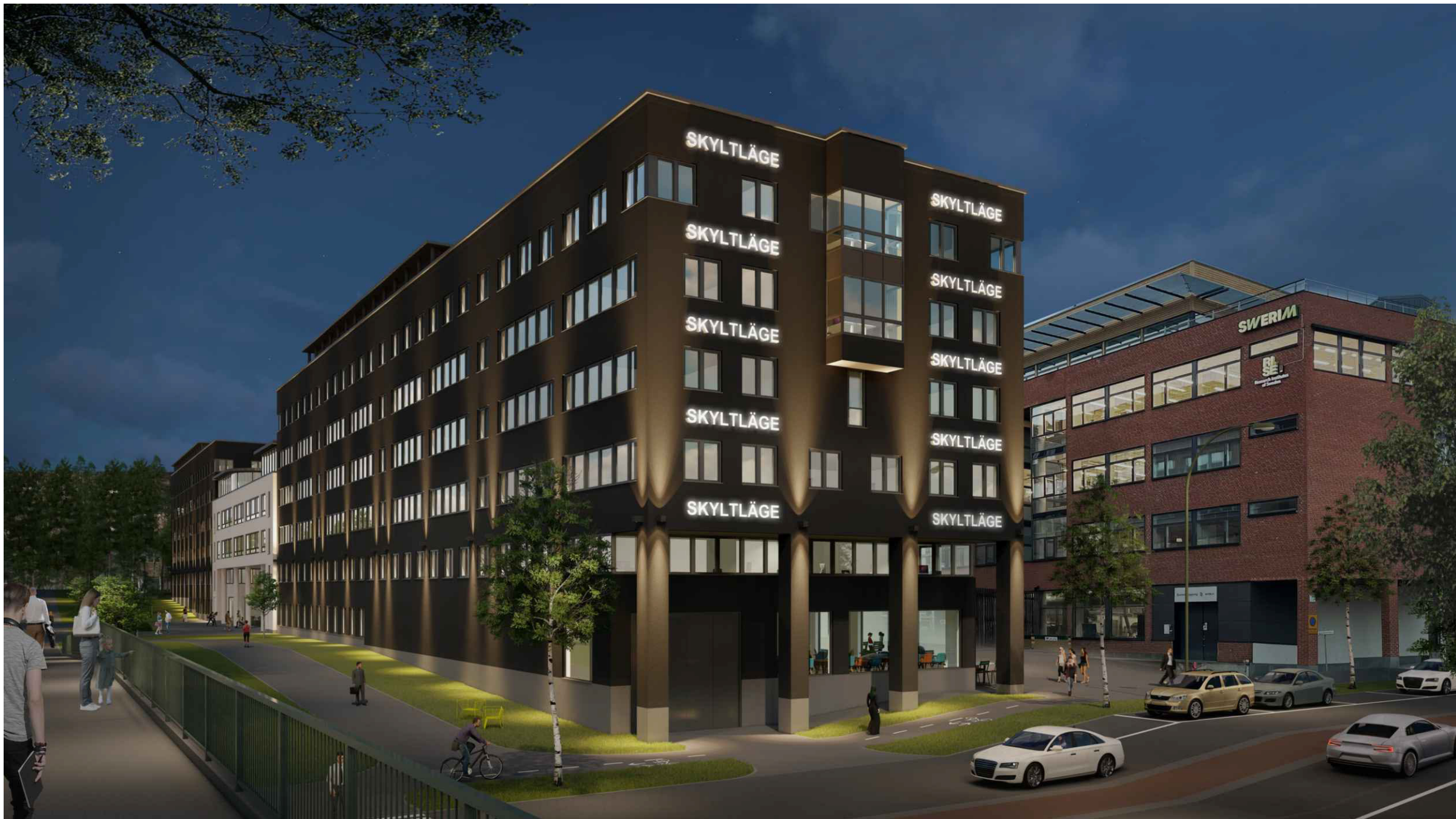
EFTER - ILLUSTRATION