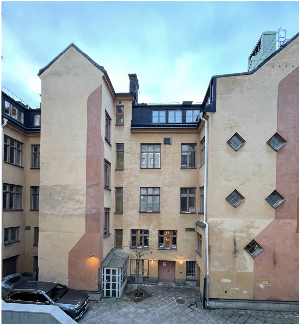
VY FRÅN TERRASS/ÖVRE GÅRD