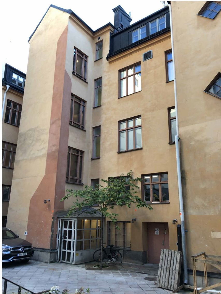
BEFINTLIG GÄRDSENTRÉ/PERSONALENTRÉ TRAPPHUS