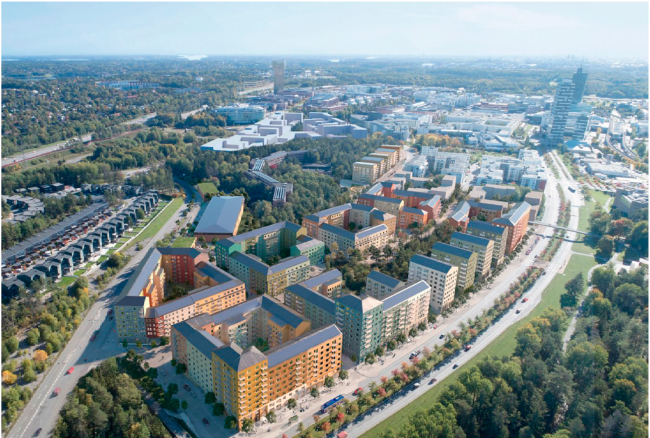
Flygbild över planerad bebyggelse sett mot Kista verksamhetsområde. Bild: Reflex Arkitekter/Ripellino Arkitekter.