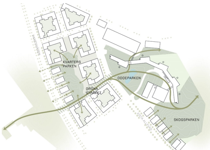
Illustration som visar parker och gröna kopplingar i området. Reflex Arkitekter/Ripellino Arkitekter.

Gatorna inom planområdet följer omgivande struktur och tillför östvästliga tvärstråk för att tydliggöra områdets kopplingar till Husby och Kistahöjden. Gatorna kopplar på, kompletterar och förstärker det befintliga gatunätet. Hanstavägen och Kista alléväg utformas som stadsgator med förbättrade vistelsevärden och en rad tvärstråk etableras för att stärka kopplingarna över Hanstavägen till Husby. Tvärstråken möjliggör en fortsättning i en framtida struktur på andra sidan Hanstavägen.