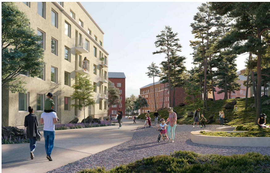
Perspektiv från gångfartsområdet och kvartersparken. Bebyggelsen i områdets mitt får en lägre skala med indragen översta våning. Bild: Reflex Arkitekter.

Fasader ska i huvudsak utföras i puts, tegel eller trä med undantag för sockel och bottenvåning mot gata. Färgsättningen ska anknyta till en klassisk färgskala som bygger på traditionella pigment. Kvarteren ska färgsättas i olika toner trapphusvis men variationer inom trapphuset får förekomma. Exempel är en ljusare ton vid översta våningen och mot gård. Taklandskapet föreslås i huvudsak utgöras av sadeltak. För att ge liv åt gaturummet där det inte planeras för centrumändamål ska bostäder ha egna entréer och upphöjd uteplats mot gata. Bostadskomplement mot allmän plats ska ha en hög andel uppglasning i fasaden. Entréer ska utföras med hög kvalitet och delvis erbjuda sittmöjligheter.