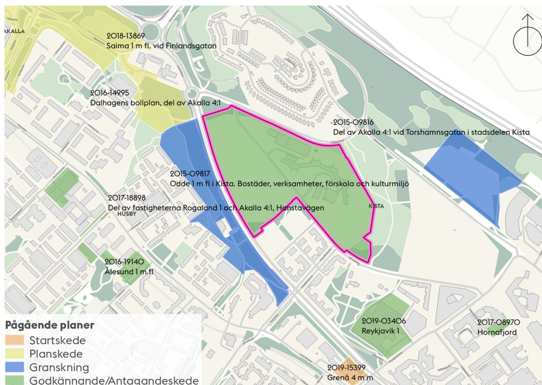
Karta som visar pågående detaljplaner och program i närområdet.

Grenå 4 m.m. (2019-15399). Syftet är att möjliggöra för bostäder och lokaler för centrumändamål. Planen är inför samråd.