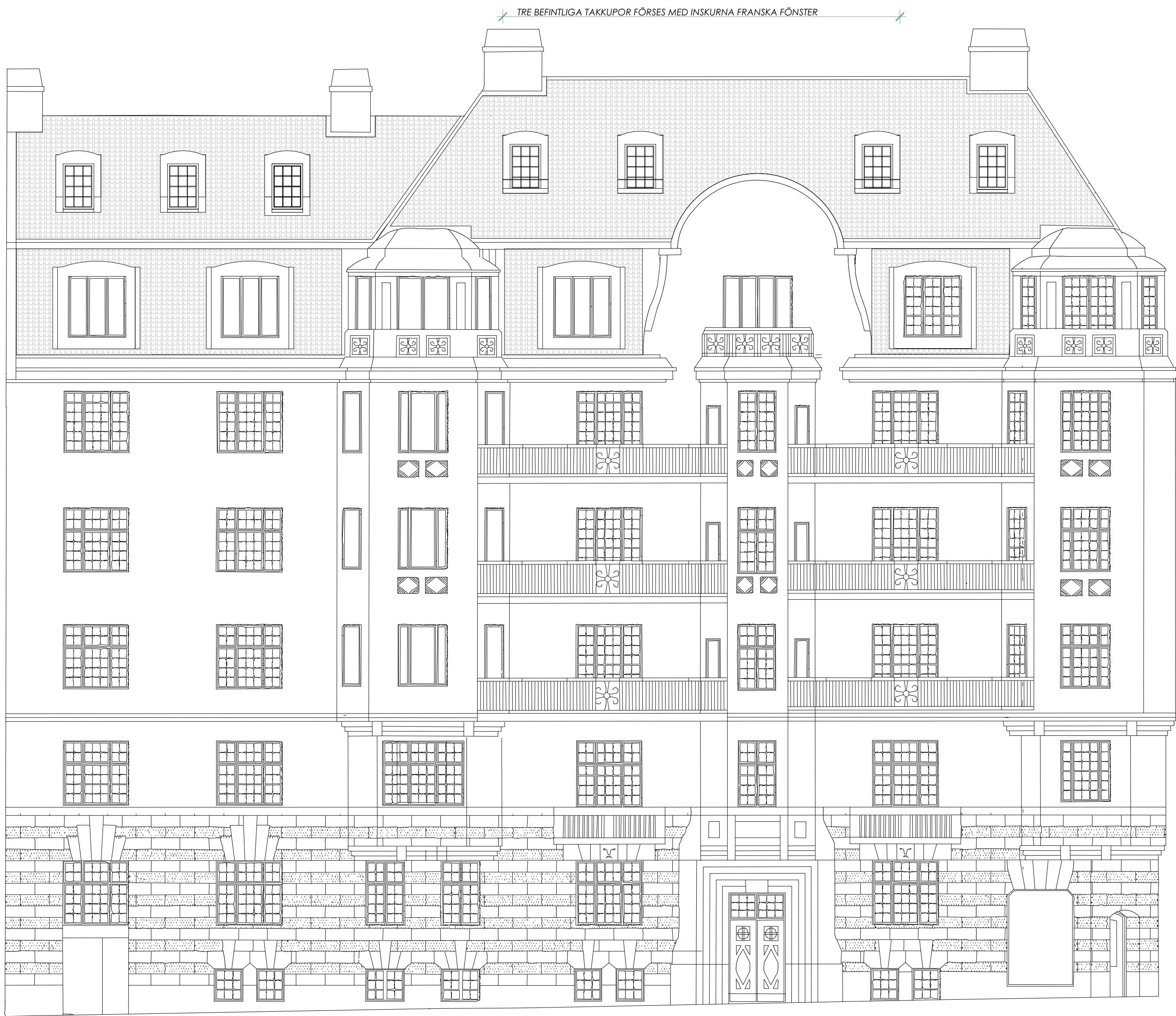
FASAD MOT GATA SKALA 1:100