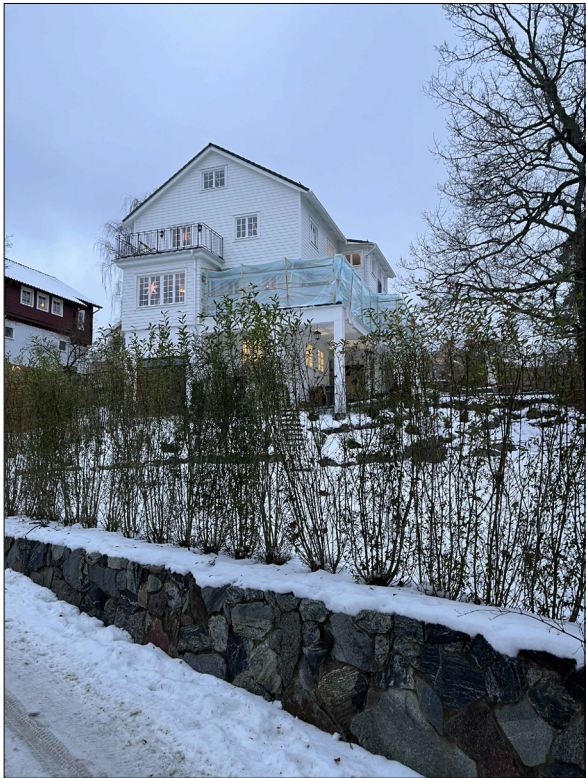
STÖDMUR FRÅN JOURNALISTGRÄND