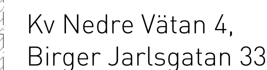
Utbyggnad av hotell. Befintlig fasad behålls och grundförstärks. Befintlig källare innanför fasad rivs.