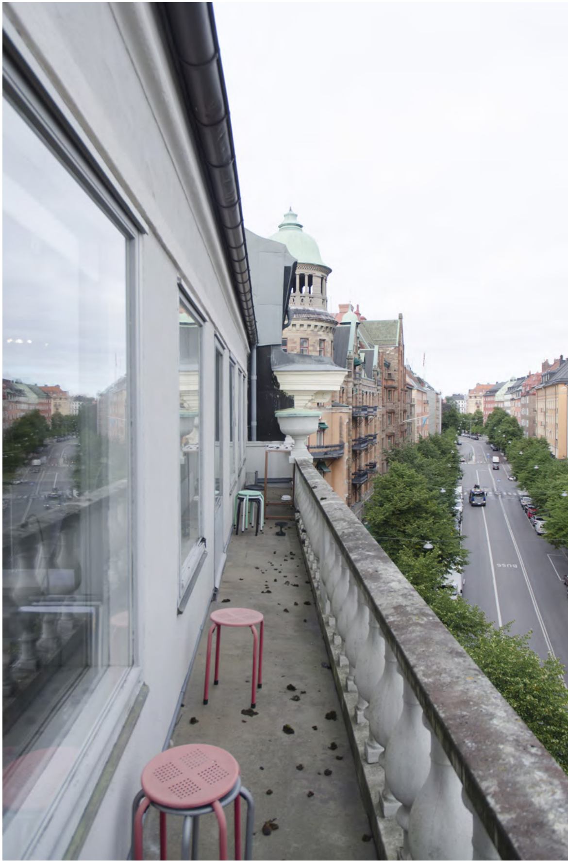
Vy från kungsbalkong mot Nedre Vätan 4