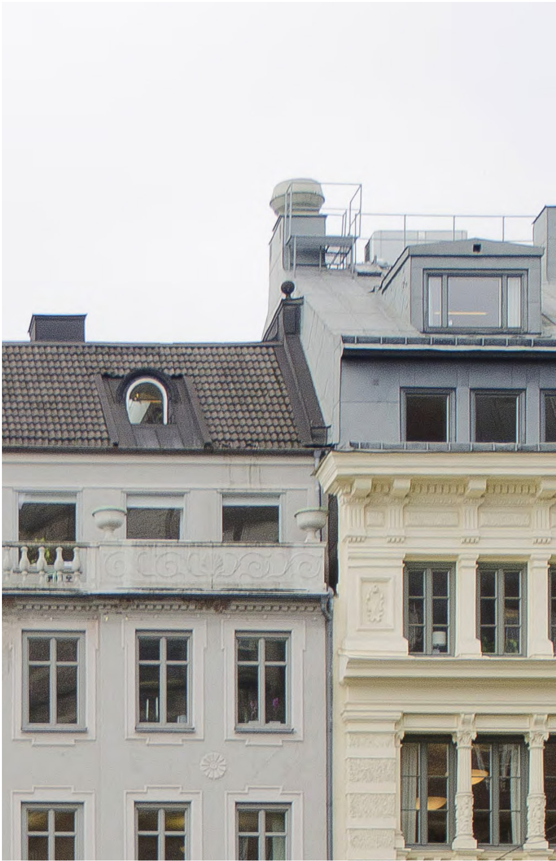
Tak Nedre Vätan 11 och Nedre Vätan 4