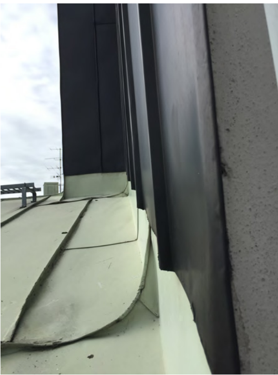
Plåtdetalj mot Nedre Vätan 13