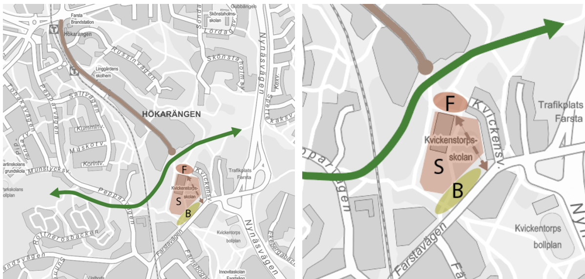
Alternativ 2. Brun streckad pil visar hur inlastning föreslås till skolan, där fordon angör vid Farstavägen och vagnar sedan dras till skolans lastkaj. Inzoomad bild till höger.