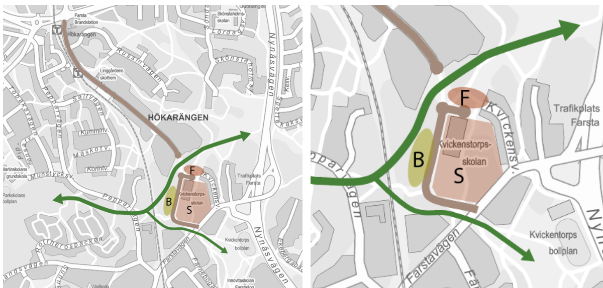
Alternativ 3. Inzoomad bild till höger.

Alternativet innebär att en ny gata dras från Farstavägen med en vändplan intill skolan och att inlastningsväg från skolan sker från denna. Lingvägen förlängs inte men möjliggör för utbyggnad av bostäder och skola.