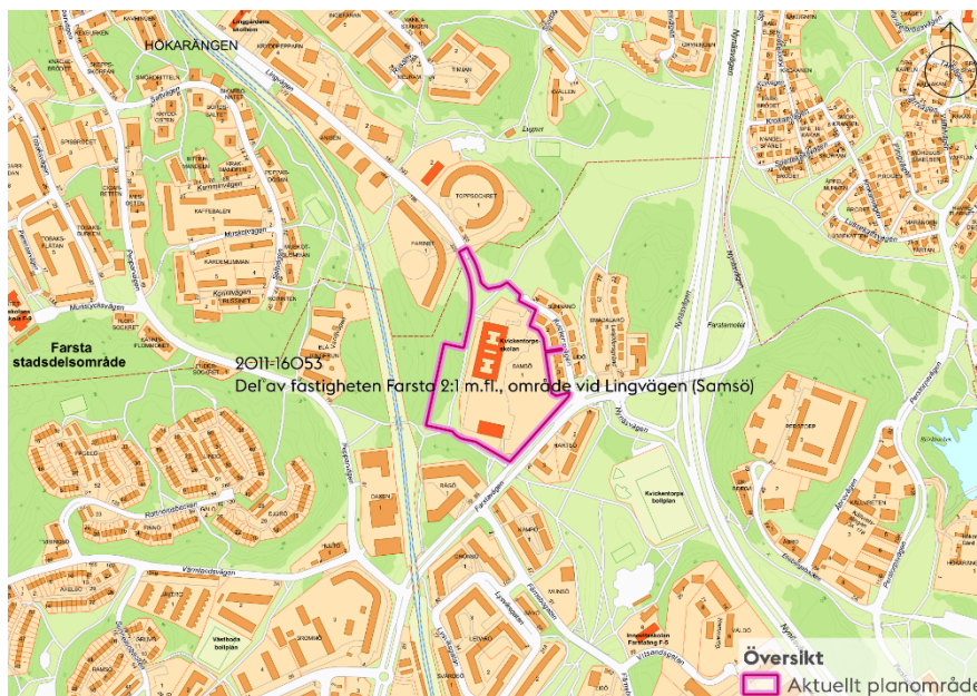
Karta som visar planområdets läge och avgränsning.

Planområdet är till största delen beläget i stadsdelen Farsta. En liten del ligger i stadsdelen Hökarängen. Det omfattar hela fastigheten Samsö 1 och en del av fastigheten Farsta 2:1 som båda ägs av staden. Samsö 1 upplåts med tomträtt till SISAB. Planområdet omfattar cirka 40 000 kvadratmeter.