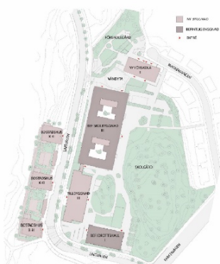
Situationsplan ur tjänsteutlåtande för redovisning av andra samrådet.

Beslut om planstart Stadsbyggnadsnämnden 19 juni 2012