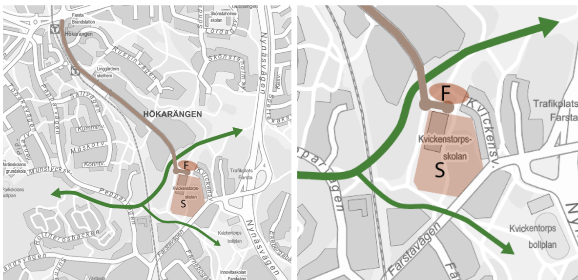
Alternativ 4. Inzoomad bild till höger.

Alternativet innebär att Lingvägen förlängs fram till skolfastighetens nordvästra hörn.