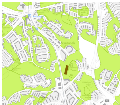
Sociotopkarta som visar var grönområden finns i och omkring Hökarängen. Brun rektangel visar den yta som föreslagna bostäder tar i anspråk.

Kontoret har utrett nämndens återremiss, i vilken föreslås att inlastning till skolan möjliggörs genom att angöring för detta placeras vid Farstavägen, liksom de nya bostäderna. Detta alternativ innebär att Lingvägen inte förlängs. Nedan går för- och nackdelar igenom, men kontoret vill redan här framhålla att alternativet inte är rimligt då det förutsätter att mark tas i anspråk vilken staden inte har rådighet över och som SISAB inte vill avyttra.