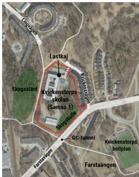
Nuvarande förhållanden i och runt planområdet.

Inga gator finns inom planområdet. Angöring till skolan sker via Kvickensvägen, en smal lokalgata kantad av parhus. Gatans bredd är inte anpassad för större fordon, vilket resulterar i att mötande fordon ibland kör upp på trottoaren. Den enda lokala bilväg som leder direkt mellan Hökarängen och Farsta är Pepparvägen på västra sidan om Farstagrenens tunnelbanespar. Trafiksäkerheten är överlag god inom och strax utanför planområdet då trafikslagen ofta är separerade. Gångvägarna runt skolan uppfyller stadens krav på säkra och trygga skolvägar.