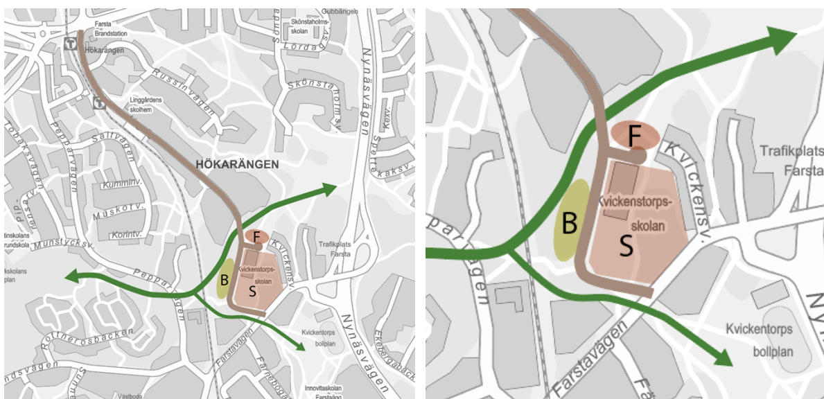
Alternativ 1. Inzoomad bild till höger.

Det första alternativet innebär att Lingvägen förlängs till Farstavägen, i enlighet med det förslag till detaljplan som kontoret lyfte till stadsbyggnadsnämnden för godkännande.