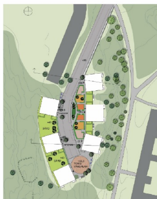
Situationsplan ur tjänsteutlåtande vid beslut om planstart.