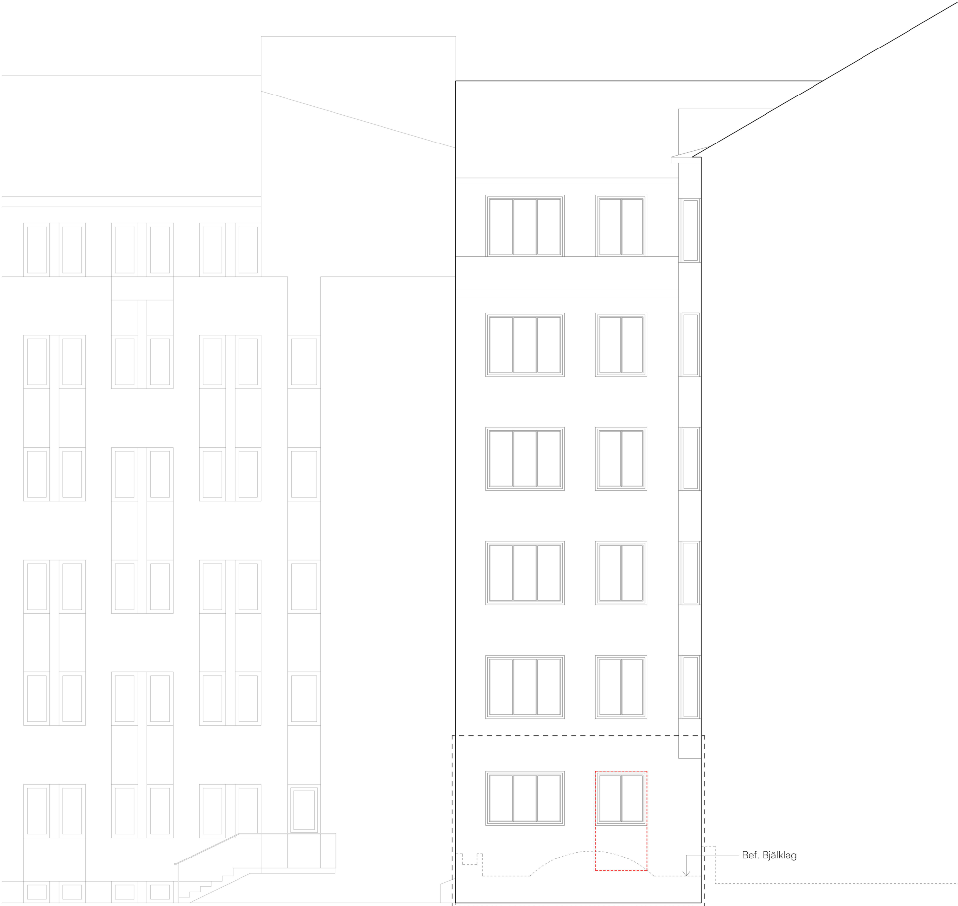
Befintlig fasad mot öster